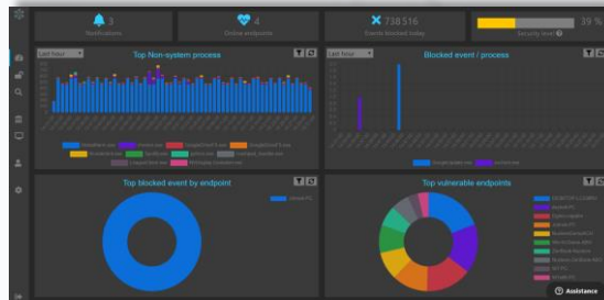
Tableau de bord