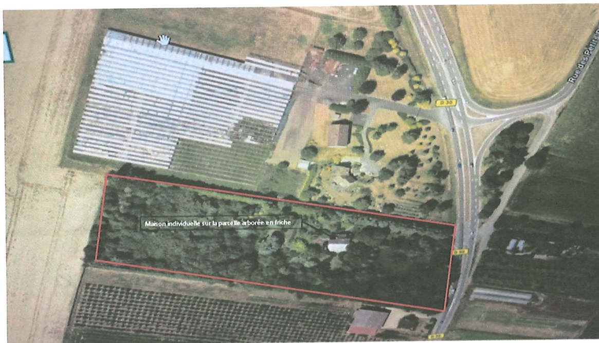
Vue aérienne de la parcelle 121 concernée par le projet

Cette parcelle n'était pas cultivée et était occupée par une maison individuelle datant du début des années 1960, située dans un ensemble clos, boisé et en friches, non entretenu depuis les années 1980-1990 comme en témoigne la photo ci-dessous.