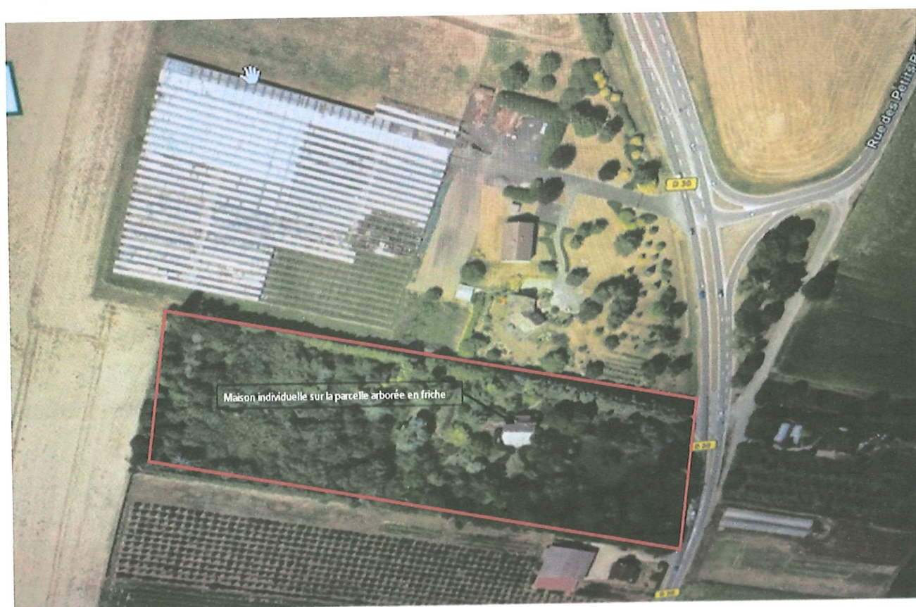
Vue aérienne de la parcelle 121 concernée par le projet