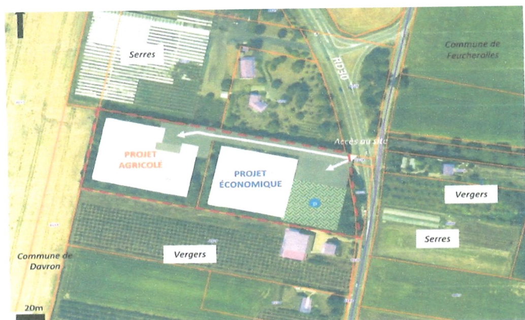
Fig 2. Situation du projet dans son environnement

Le commissaire enquêteur souligne que l'impact du projet est important non seulement pour la commune de DAVRON mais aussi pour l'ensemble des communes de la Communauté de Communes Gally-Mauldre.