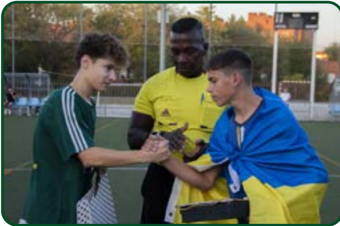
Saludo entre capitanes e intercambio de regalos