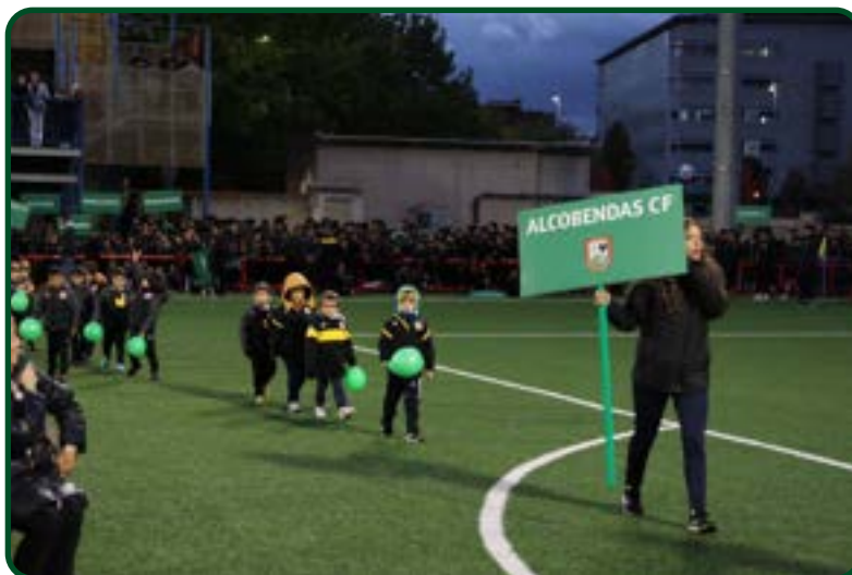
Salida de nuestros jugadores más pequeños en la presentación