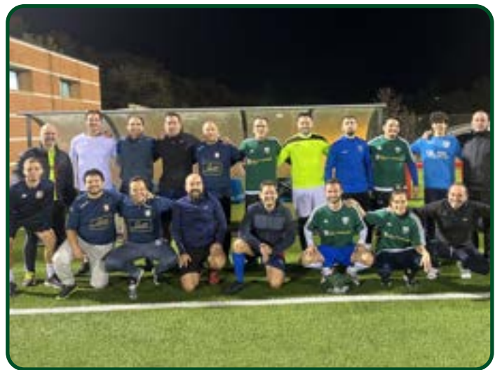
Padres, entrenadores y nuestro presidente en la liga de padres del club

Este año jugamos con el número 95.187 . ¿Y si toca?