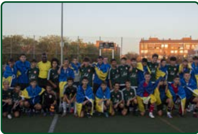
Foto de ambos equipos previa al partido