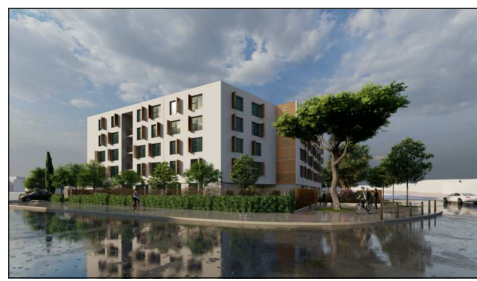
Etage: PARKING R-2