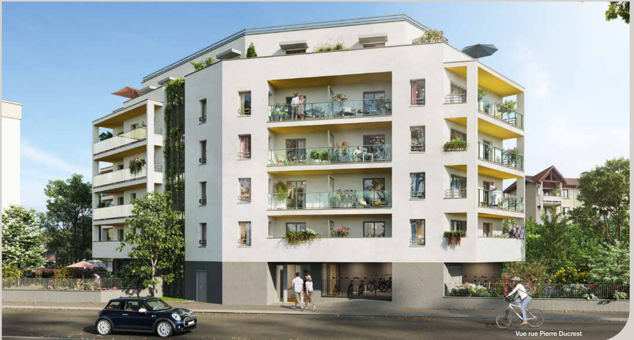
Vue rue Pierre Ducrest