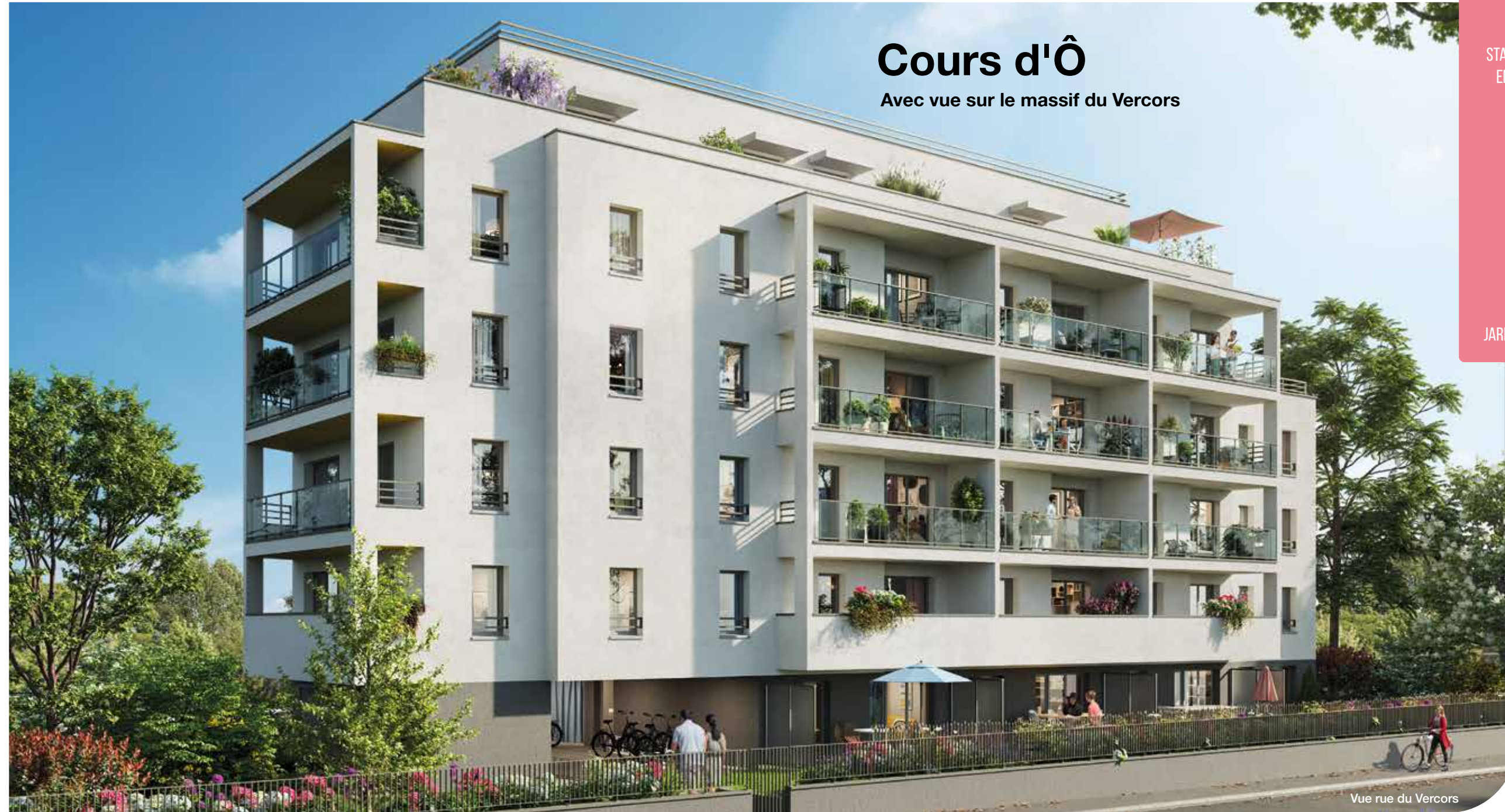
Vue rue du Vercors