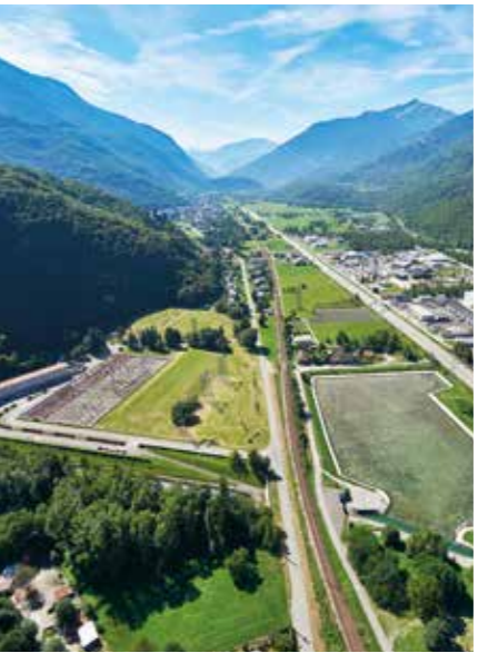
La Bâthie - Centrale électrique