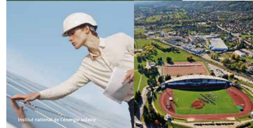
Institut national de l'énergie solaire