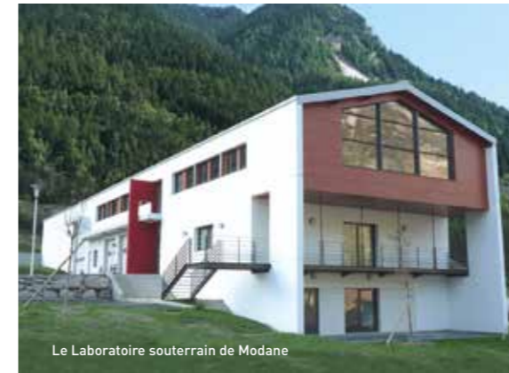
Le Laboratoire souterrain de Modane

La Savoie bénéficie également d'une situation géographique stratégique, limitrophe de l'Italie et proche de grands Centres Économiques Européens comme Genève, Lyon ou Turin. Au cœur du sillon alpin, le département est de fait un axe incontournable, sur lequel se sont développées des zones urbaines au caractère bien trempé : Chambéry, Aix-les-Bains et le lac du Bourget, et bien entendu Albertville.