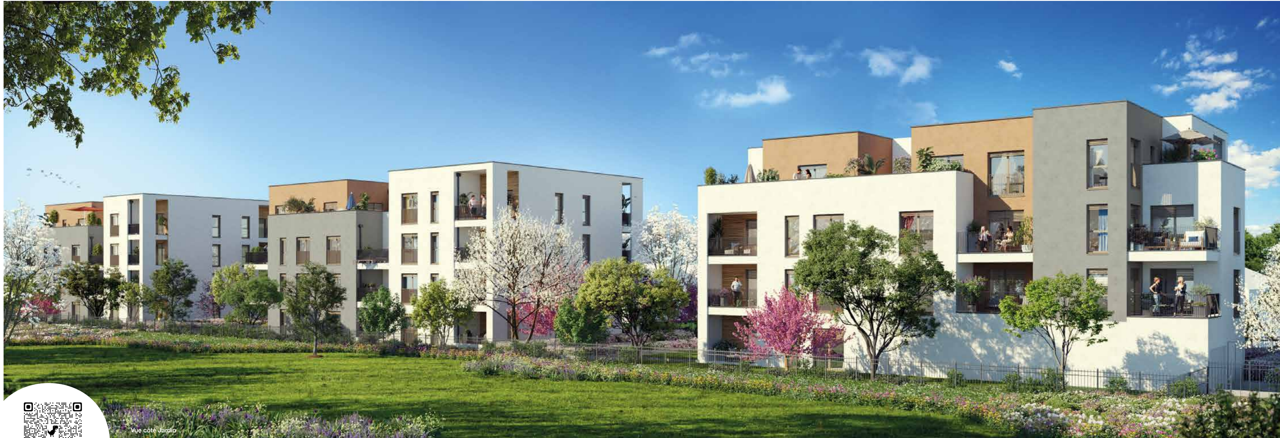
Vue côté Jardin