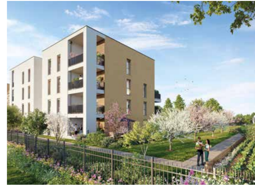
Vue du Chemin de la Combe de Savoie