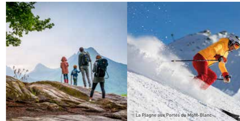
La Plagne aux Portes du Mont-Blanc