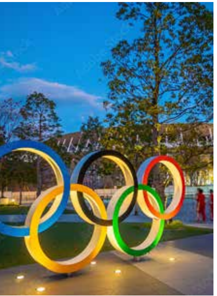
Jeux Olympiques d'hiver Albertville 1992