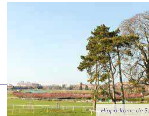
Hippodrome de Sa