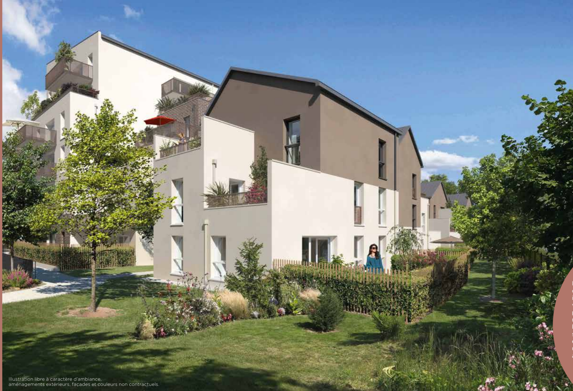
Illustration libre à caractère d'ambiance, aménagements extérieurs, façades et couleurs non contractuels.