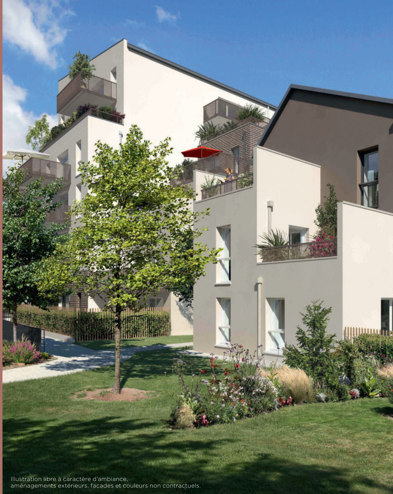
Illustration libre à caractère d'ambiance, aménagements extérieurs, façades et couleurs non contractuels.