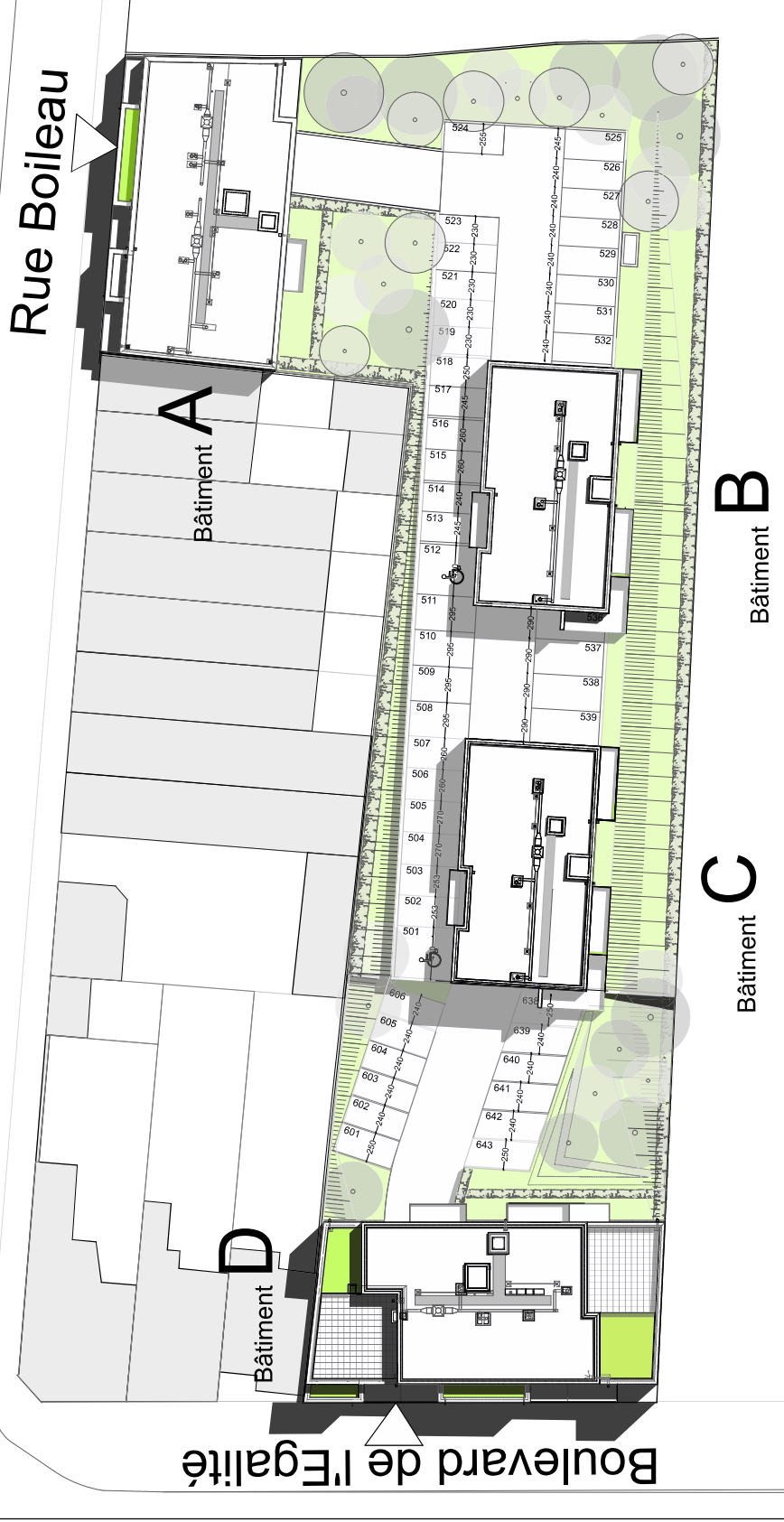
PLAN MASSE 1/500

Frédéric Moulin Architecte 18 rue de Crèvecoeur 7640 Antoing Belgique 3 rue Richelieu 139100 Roubaix Fr Port : f.moulin@ymail.com E-mail : f.moulin@gmail.com