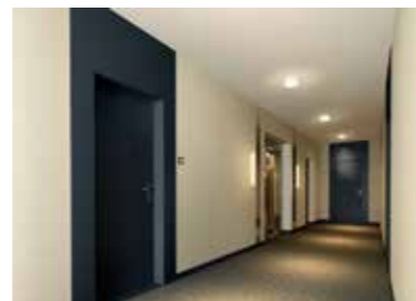
Images non contractuelles à titre d'exemple d'un hall sur la gamme Imagination.