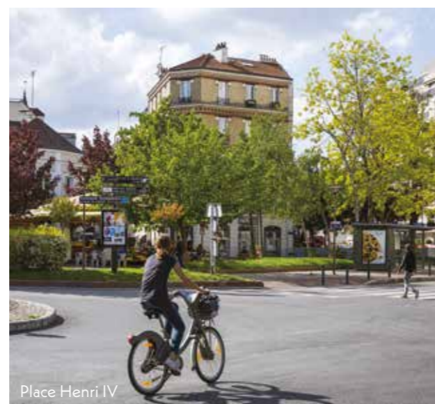
Place Henri IV

Atelier Lumière s'installe au sein du quartier Liberté et profite d'un environnement résidentiel calme et familial. À proximité directe du Mont Valérien, votre futur appartement est proche des établissements scolaires, des commerces, des services et des équipements sportifs. À deux pas, une ligne de bus permet de rejoindre le pôle de La Défense en seulement 20 min*.