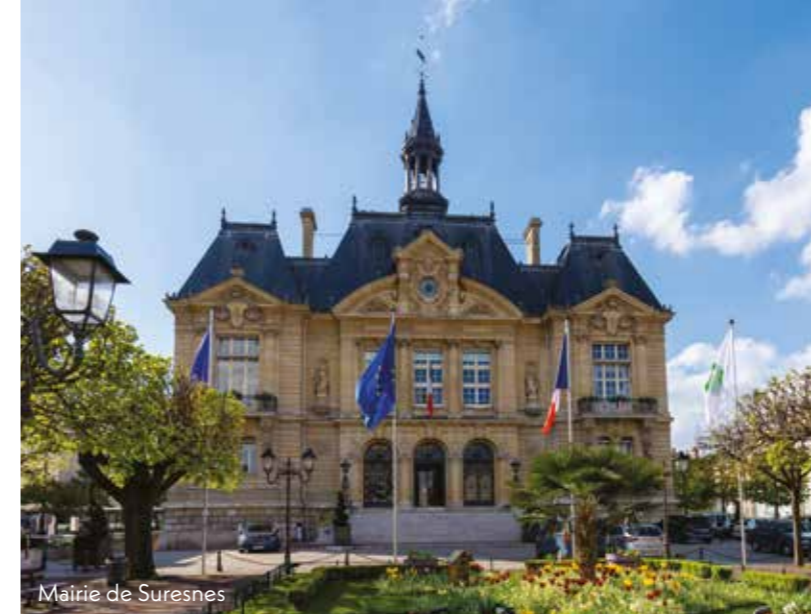
Mairie de Suresnes

À 2 KM* de La Défense À 3,5 KM* de la Porte d'Auteuil 326 175 M 2 d'espaces verts