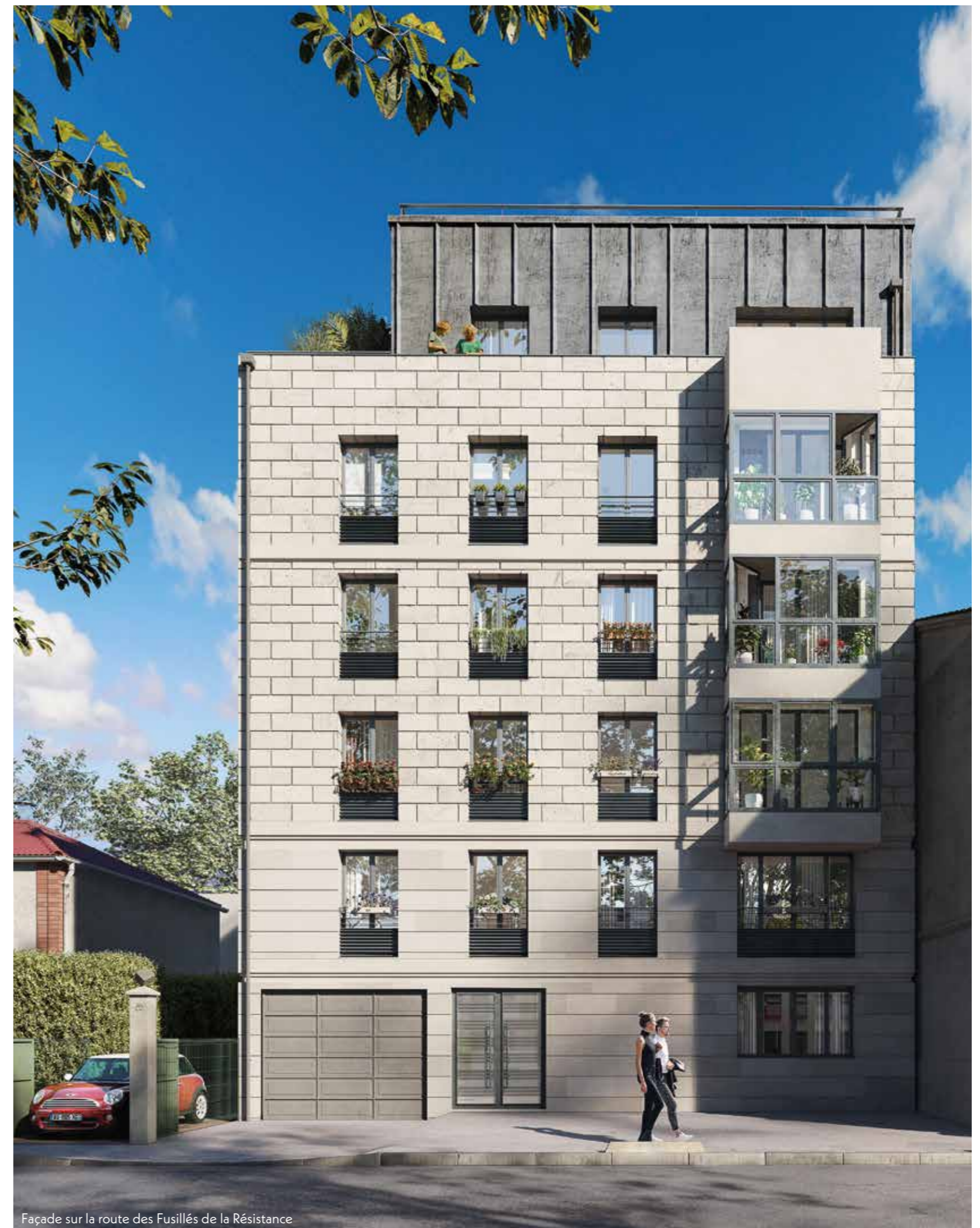
Façade sur la route des Fusillés de la Résistance