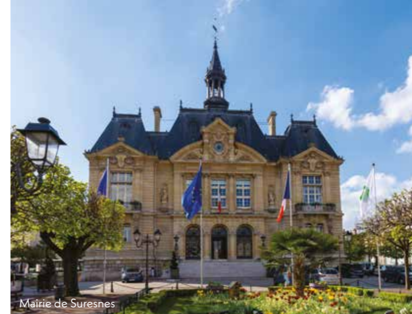
Mairie de Suresnes

À 2 KM* de La Défense À 3,5 KM* de la Porte d'Auteuil 326 175 M 2 d'espaces verts