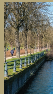
Berges de la Deûle