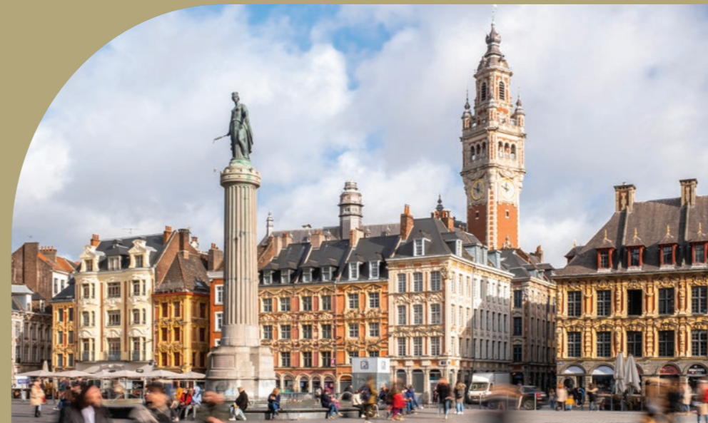
Grand Place de Lille