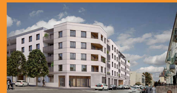
Avenue Victoria - Avenue Mairie de Solms 73100 Aix les Bains