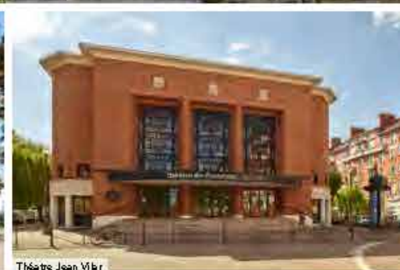
Théâtre Jean Vilar