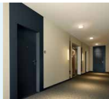
Images non contractuelles à titre d'exemple d'un Hall sur la gamme Séduction.

Dans les Halls Pure, les frontières entre les matières s'effacent pour créer un ensemble décoratif harmonieux et épuré, résolument apaisant. La lumière et les couleurs naturelles sont mises à l'honneur.