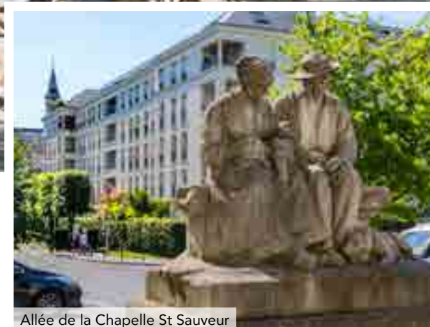
Allée de la Chapelle St Sauveur