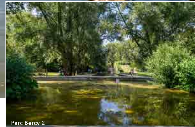
Bois de Vincennes