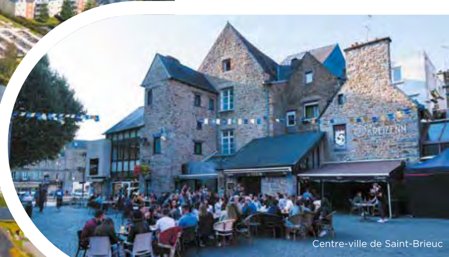
Centre-ville de Saint-Brieuc