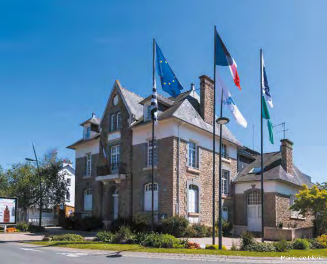
Mairie de Plérin