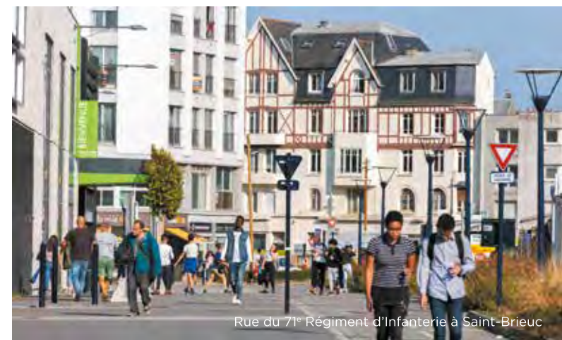
Rue du 71 e Régiment d'Infanterie à Saint-Brieuc