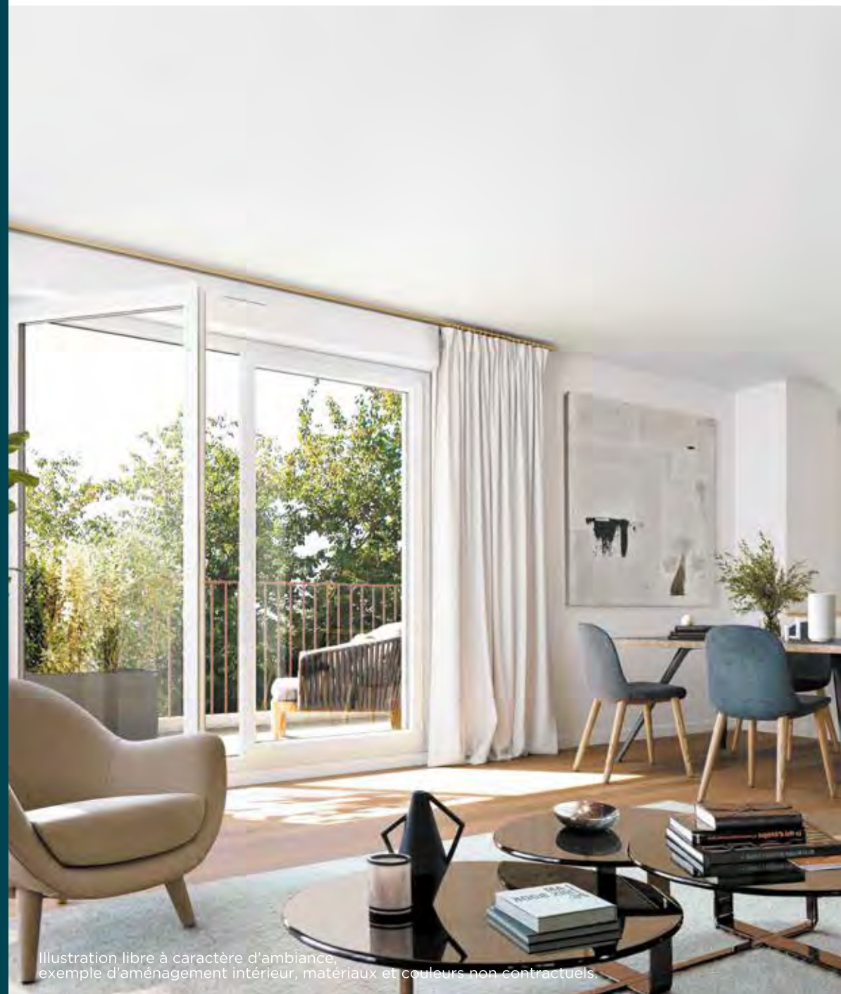
Illustration libre à caractère d'ambiance, exemple d'aménagement intérieur, matériaux et couleurs non contractuels.