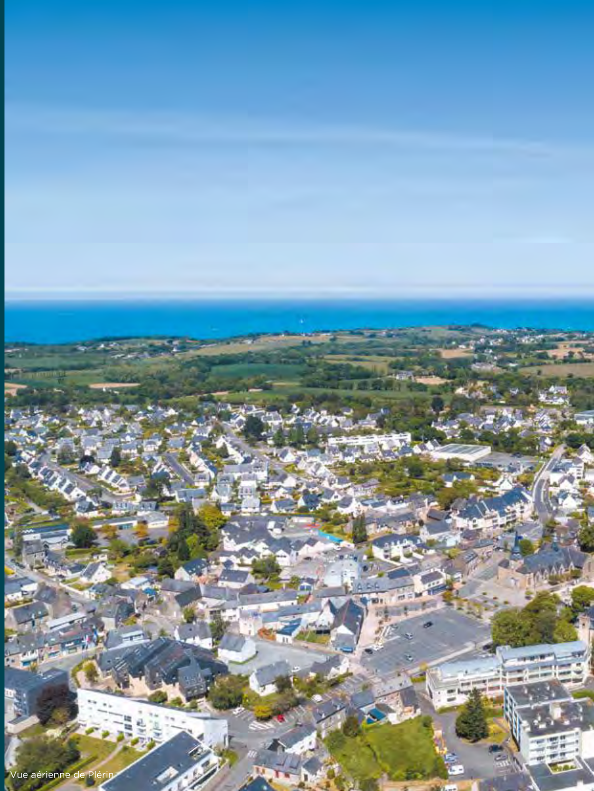
Vue aérienne de Plérin

Plérin offre plusieurs atmosphères à travers les différents quartiers qui composent sa personnalité si attachante : cœur de ville paisible et convivial, vaste littoral, ambiance maritime... À la lisière de Saint-Brieuc, le Port du Légué est ainsi l'un des lieux phares de la vie plérinaise. Il fait bon de se promener le long du quai où sont amarrés les navires de plaisance et de déjeuner sur la place de la Résistance reconnaissable avec ses pittoresques façades colorées. Ce petit port propose aussi quelques commerces et un marché plein de charme le mercredi matin.