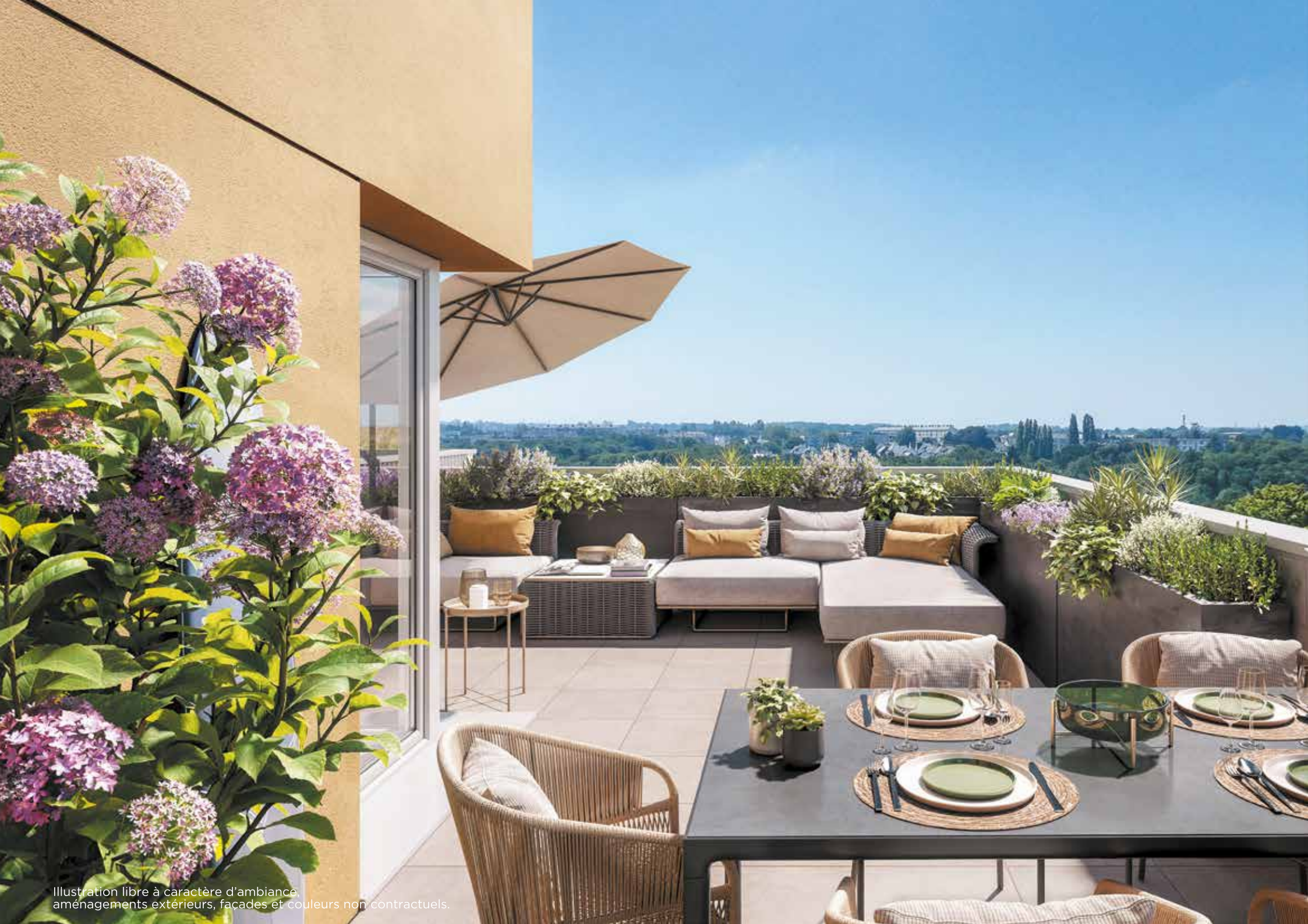
Illustration libre à caractère d'ambiance, aménagements extérieurs, façades et couleurs non contractuels.