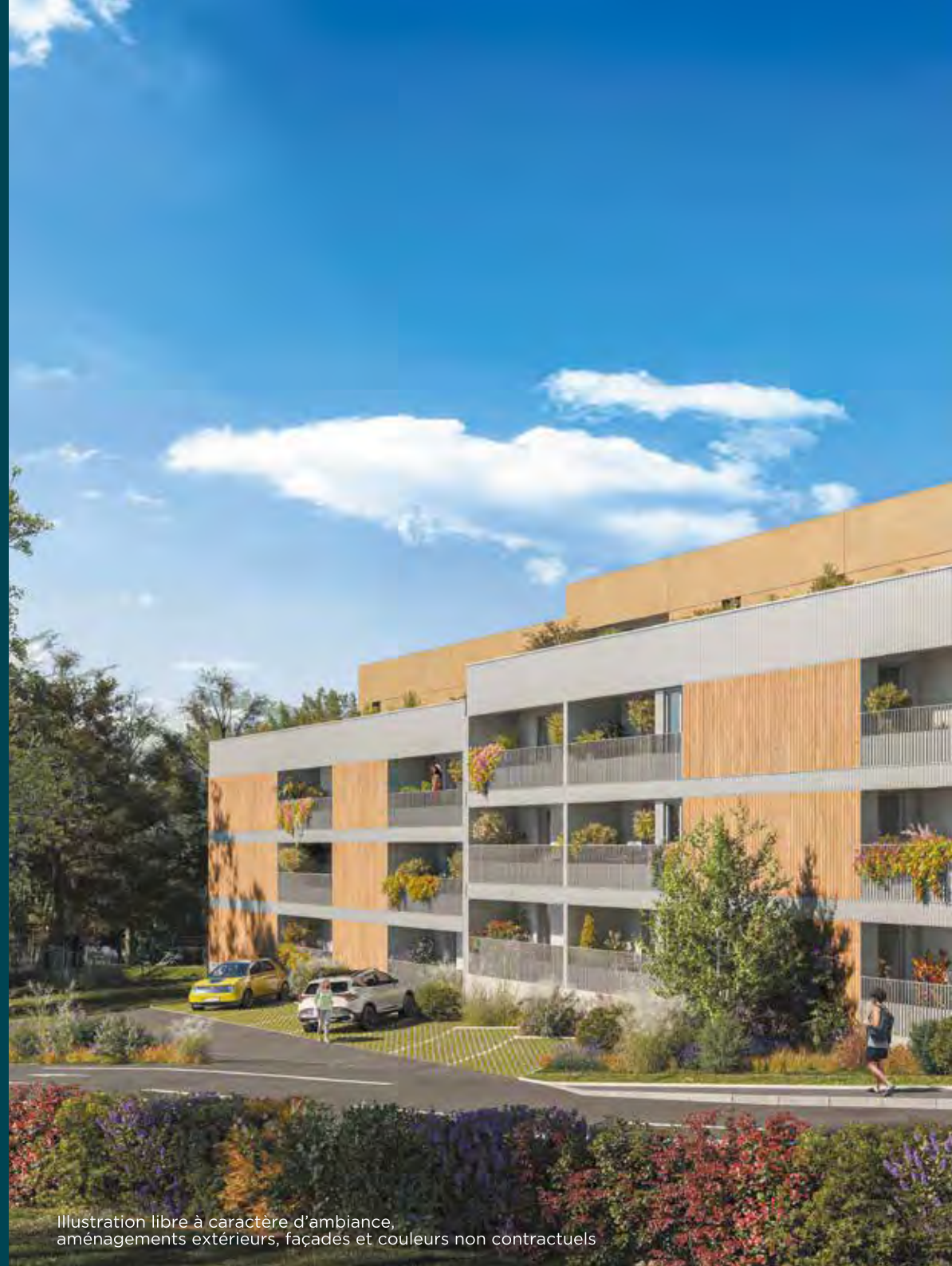
Illustration libre à caractère d'ambiance, aménagements extérieurs, façades et couleurs non contractuels

Son style contemporain se traduit par le mariage de matériaux nobles et naturels. Les volumes s'habillent alternativement de bardages en bois lasuré et de bardages métalliques dont les fines ondulations jouent avec la luminosité ambiante. Des enduits lisses parent d'une teinte gris aluminium le fond des nombreuses loggias présentes en façades, tandis que les émergences en attique optent pour une nuance brune en harmonie avec le bois. Au pourtour du bâtiment et à la pointe de la propriété, les résidents profitent de grands espaces verts en pleine terre, véritable filtre végétal généreusement arboré.