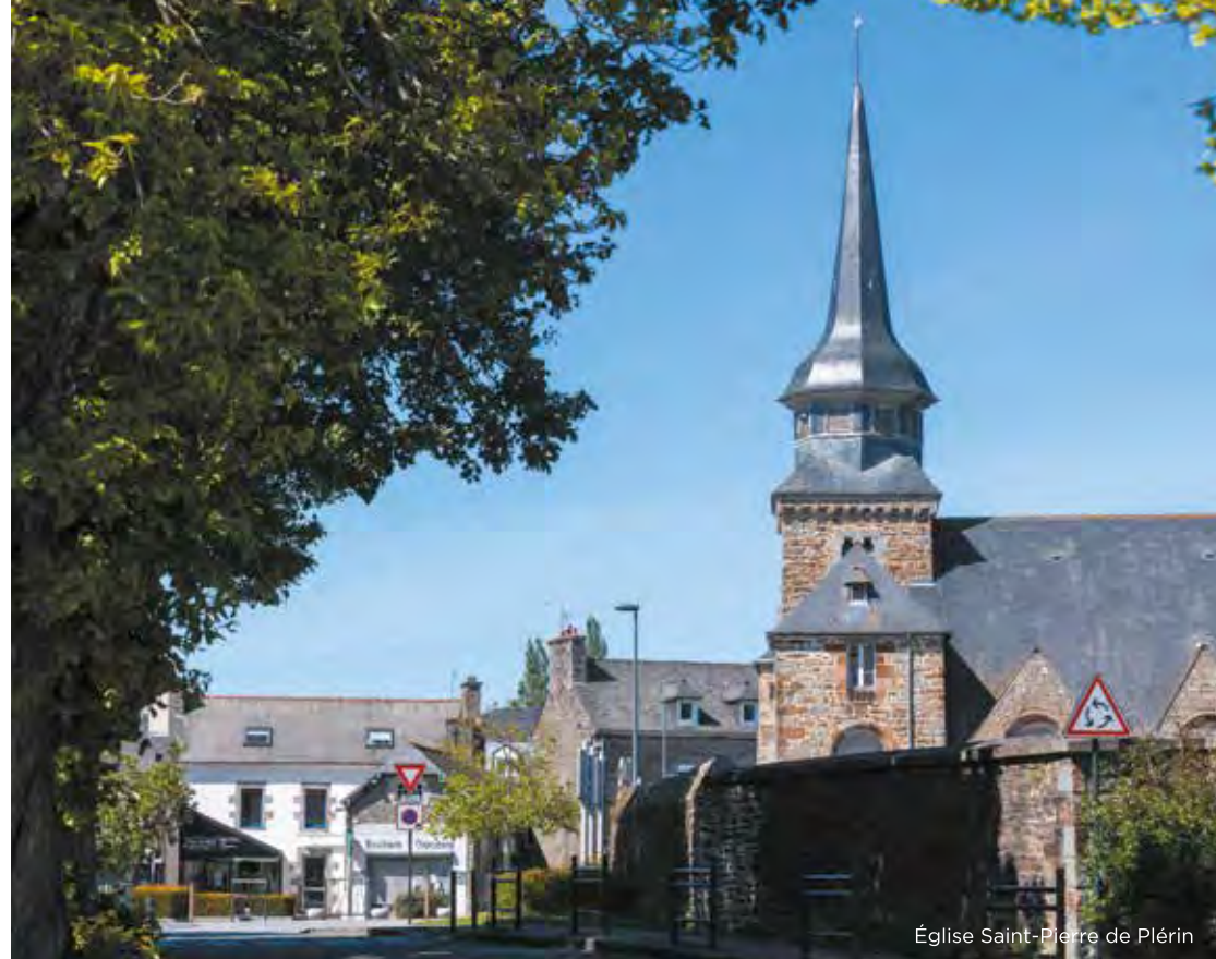
Église Saint-Pierre de Plérin