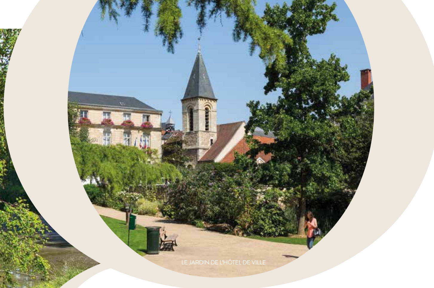
LE JARDIN DE L'HÔTEL DE VILLE