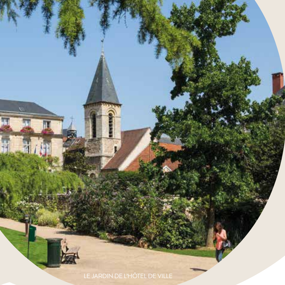
LE JARDIN DE L'HÔTEL DE VILLE