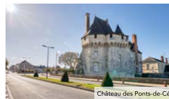
Château des Ponts-de-Cé