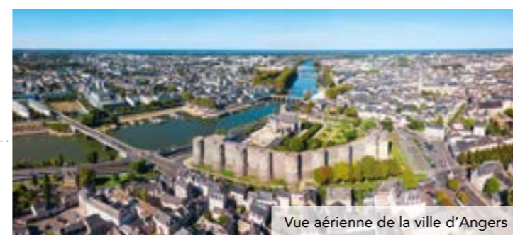
Vue aérienne de la ville d'Angers