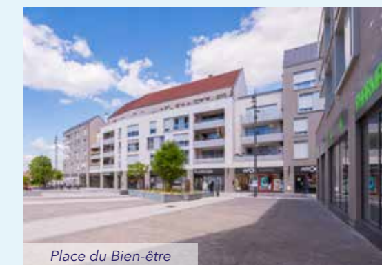
Place du Bien-être

Sans oublier l'écoquartier Bellefontaine, conçu comme un grand jardin habité où sont favorisées les circulations douces. C'est ici que Les terrasses de Bellefontaine vous invitent à couler des jours heureux, à deux pas du parc de l'Eau qui dort.