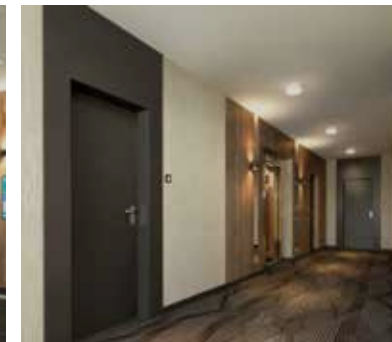
Images non contractuelles à titre d'exemple d'un Hall sur la gamme Imagination.