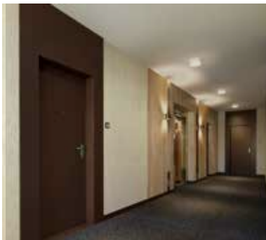
Images non contractuelles à titre d'exemple d'un Hall sur la gamme Imagination.