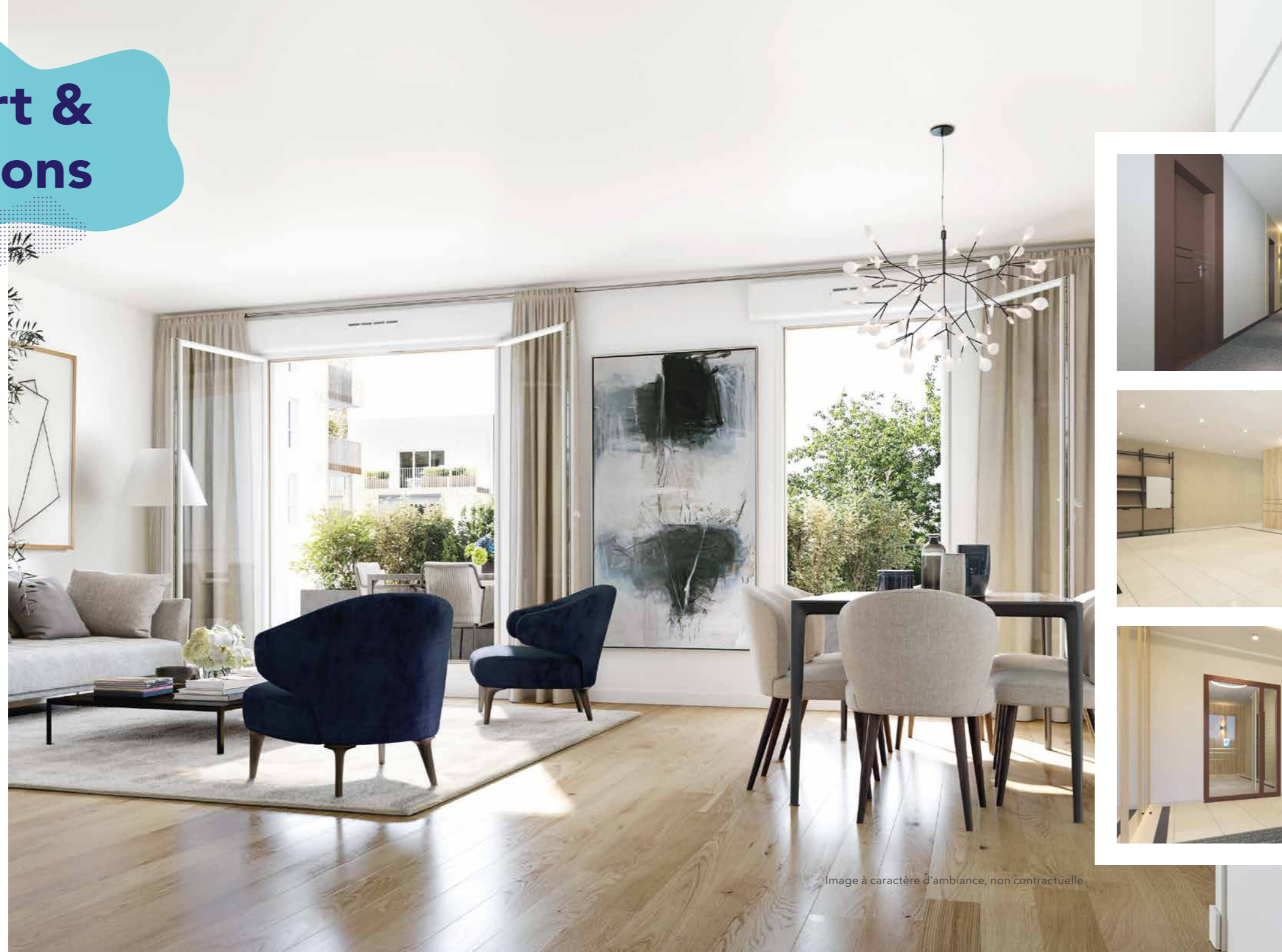
*Image à caractère d'ambiance, non contractuelle

Personnalisez votre logement grâce à la matériauthèque