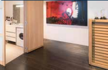
Exemples d'aménagements et d'équipements livrés

CHOISISSEZ VOS PRESTATIONS DANS NOS SHOW-ROOMS