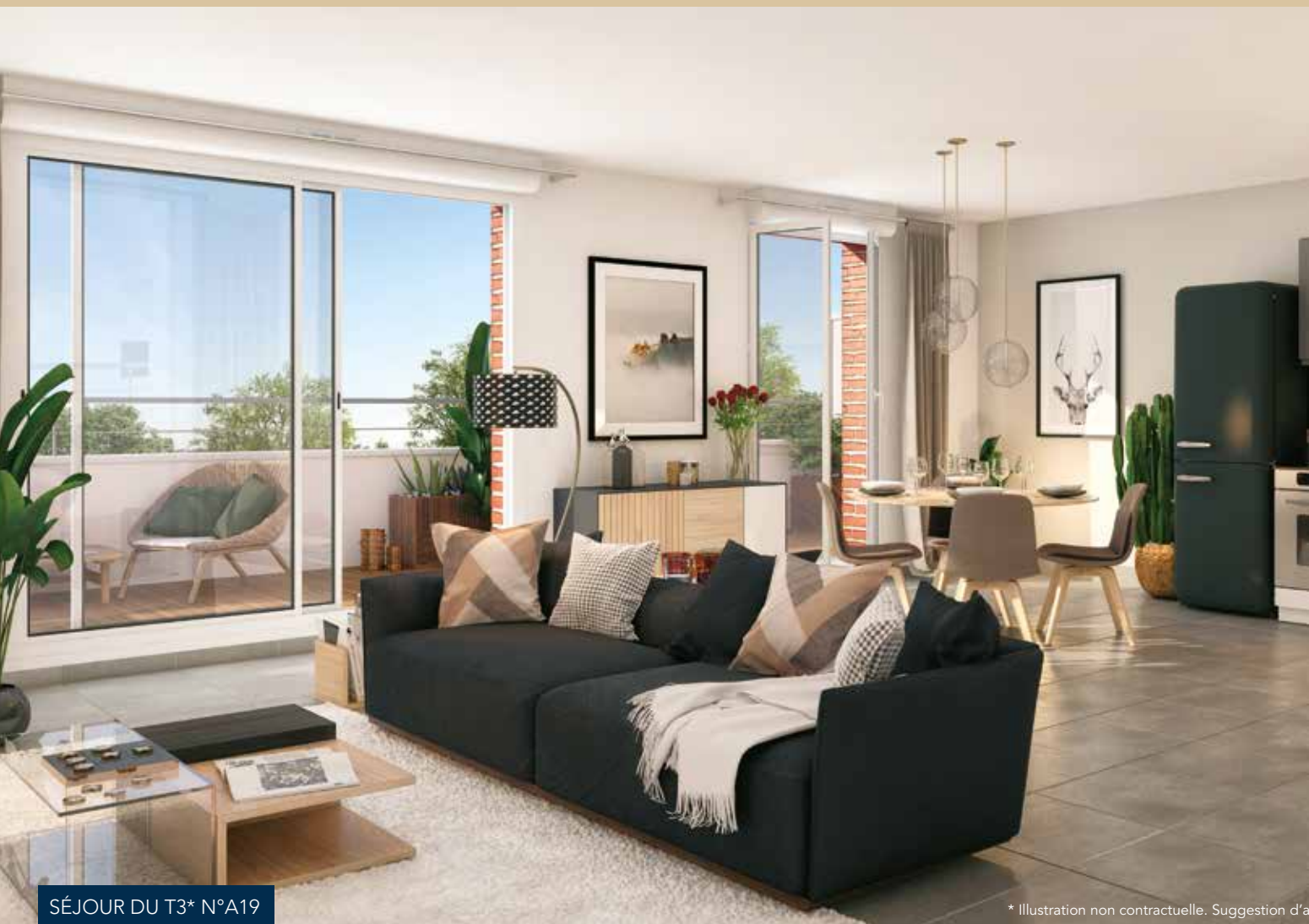
SÉJOUR DU T3* N°A19

* Illustration non contractuelle. Suggestion d'a