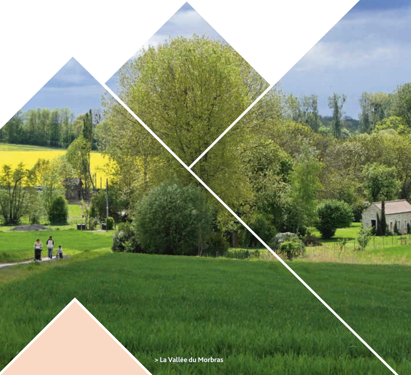
> La Vallée du Morbras

Les commerces, la Mairie, le marché de produits frais, la Poste, le gymnase Pierre de Coubertin, le stade Léo Lagrange, la bibliothèque George Sand ainsi que la Maison Henri Rouart et ses nombreuses expositions, concerts et spectacles sont accessibles à pied.