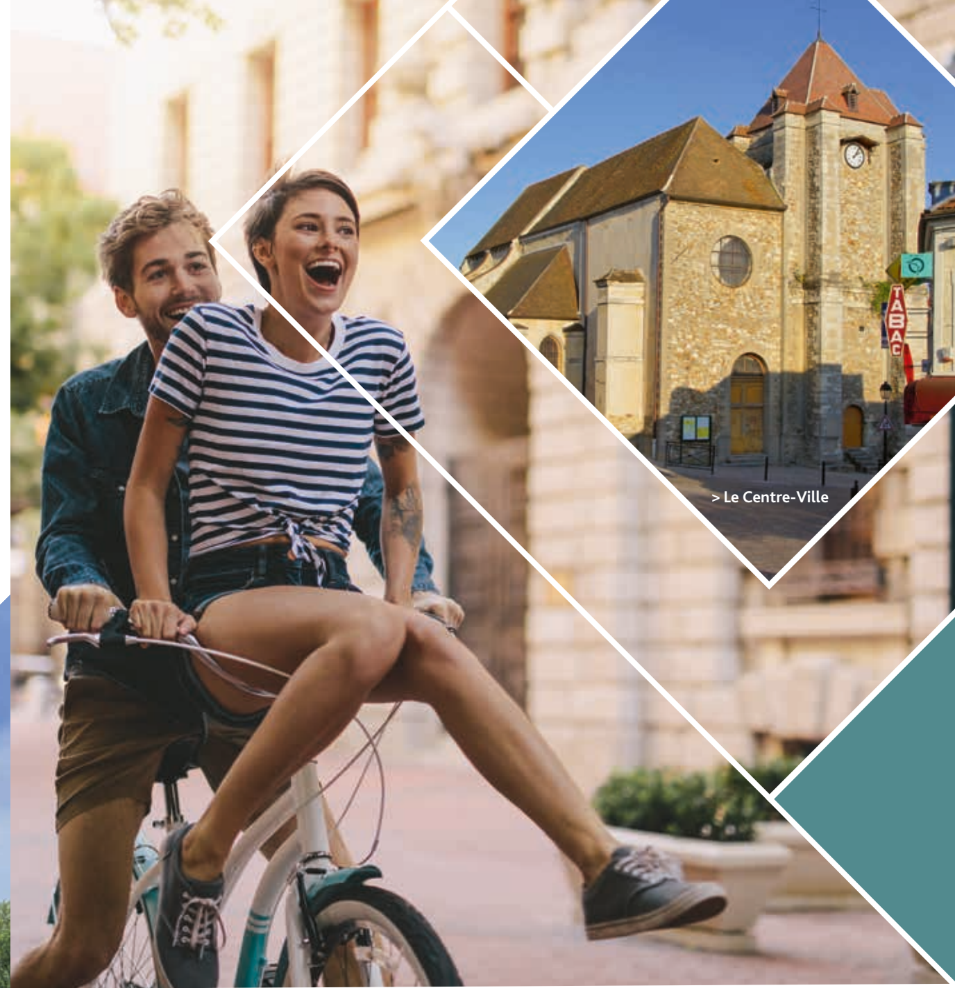
> Le Centre-Ville

L'Ernestine vous invite à découvrir une adresse idéale pour devenir propriétaire. Dans ce quartier central, vivant et familial, tout ce qui fait un quotidien agréable se trouve dans les rues alentour.