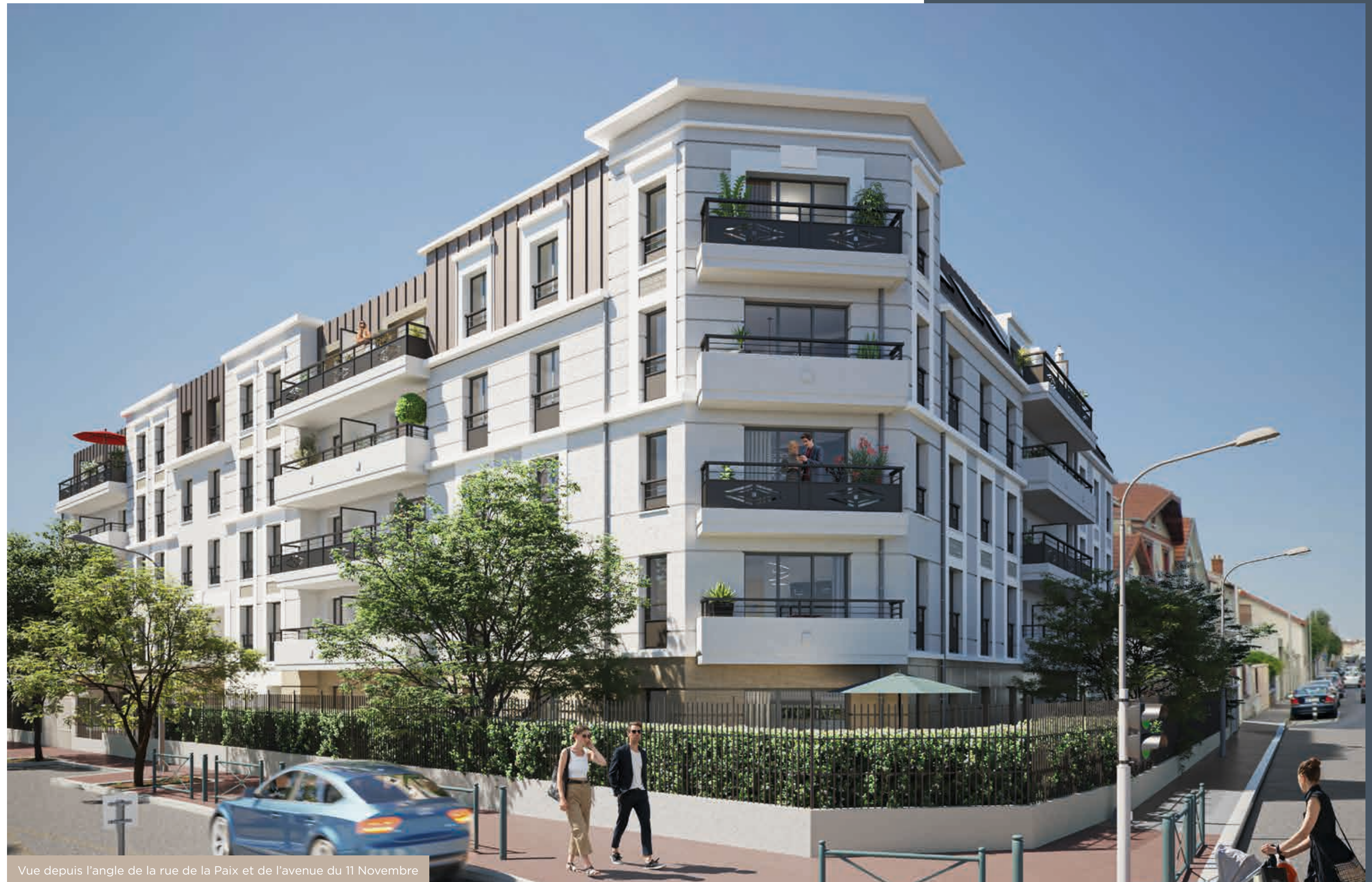
Vue depuis l'angle de la rue de la Paix et de l'avenue du 11 Novembre

Résolument urbaines côtés rue, les façades deviennent plus intimes en cœur d'îlot et les larges ouvertures idéalement orientées sur les jardins paysagers laissent la lumière naturelle inonder les intérieurs.