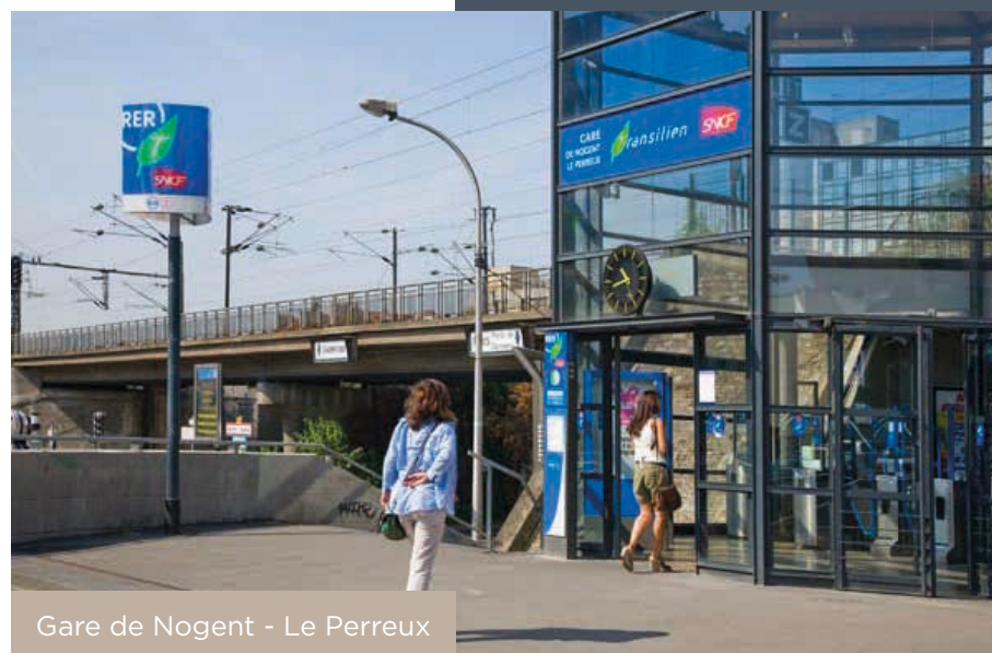
Gare de Nogent - Le Perreux