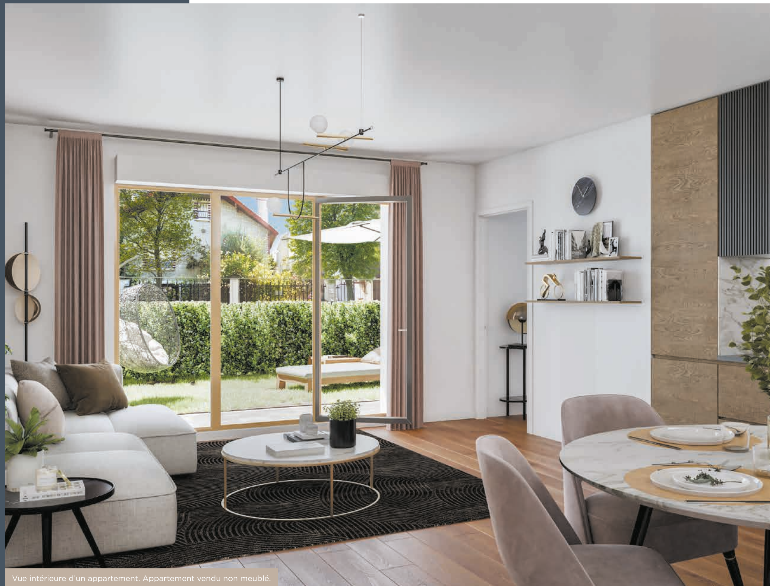
Vue intérieure d'un appartement. Appartement vendu non meublé.

Des places de stationnement en sous-sol, des caves et des locaux à vélos complètent l'offre de cette résidence de standing entièrement sécurisée.