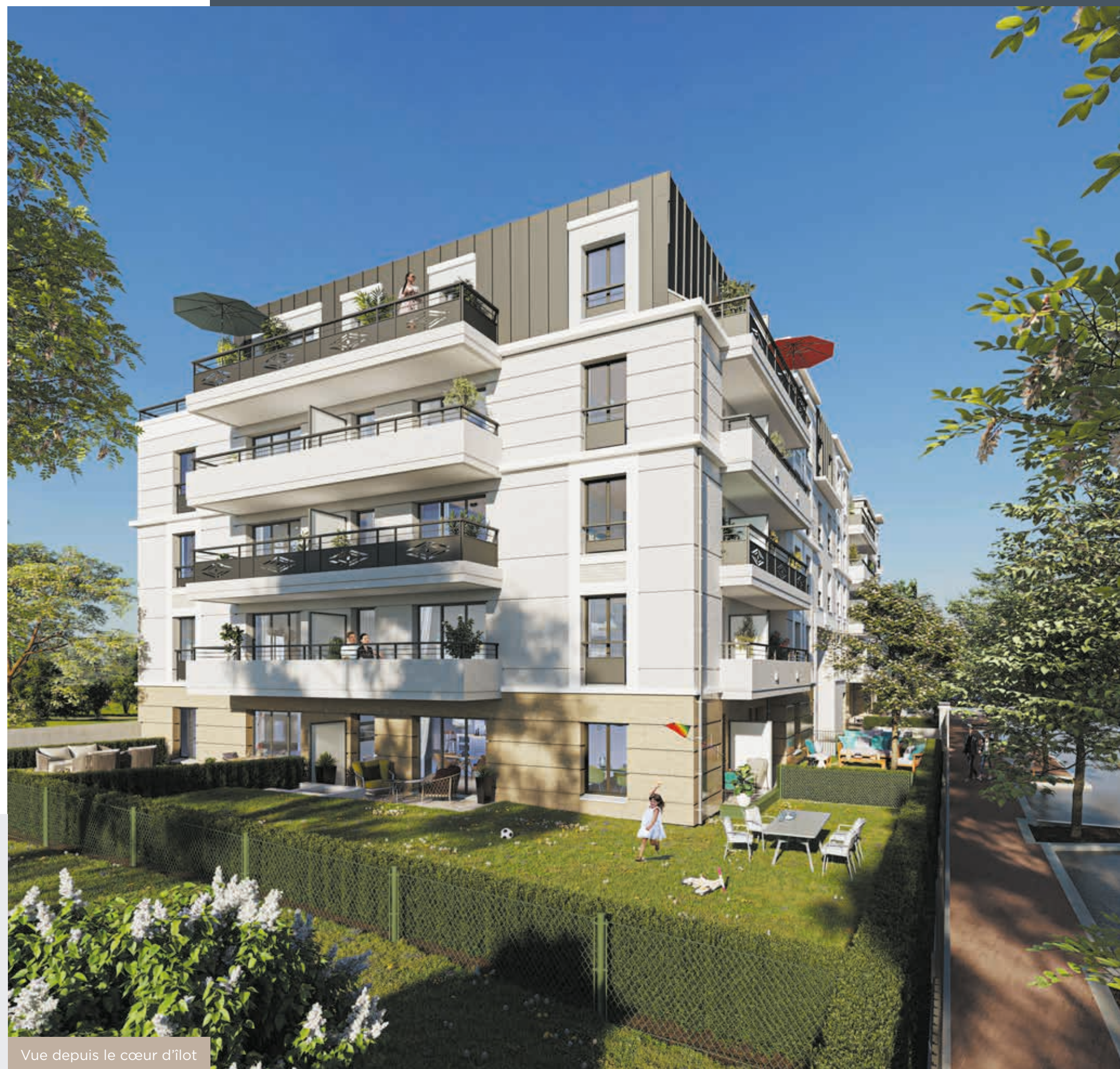
Vue depuis le cœur d'îlot

Des haies de charmilles et de hêtres, utilisées dans les jardins à la française, protègent les jardins privatifs en rez-de-chaussée des regards extérieurs.