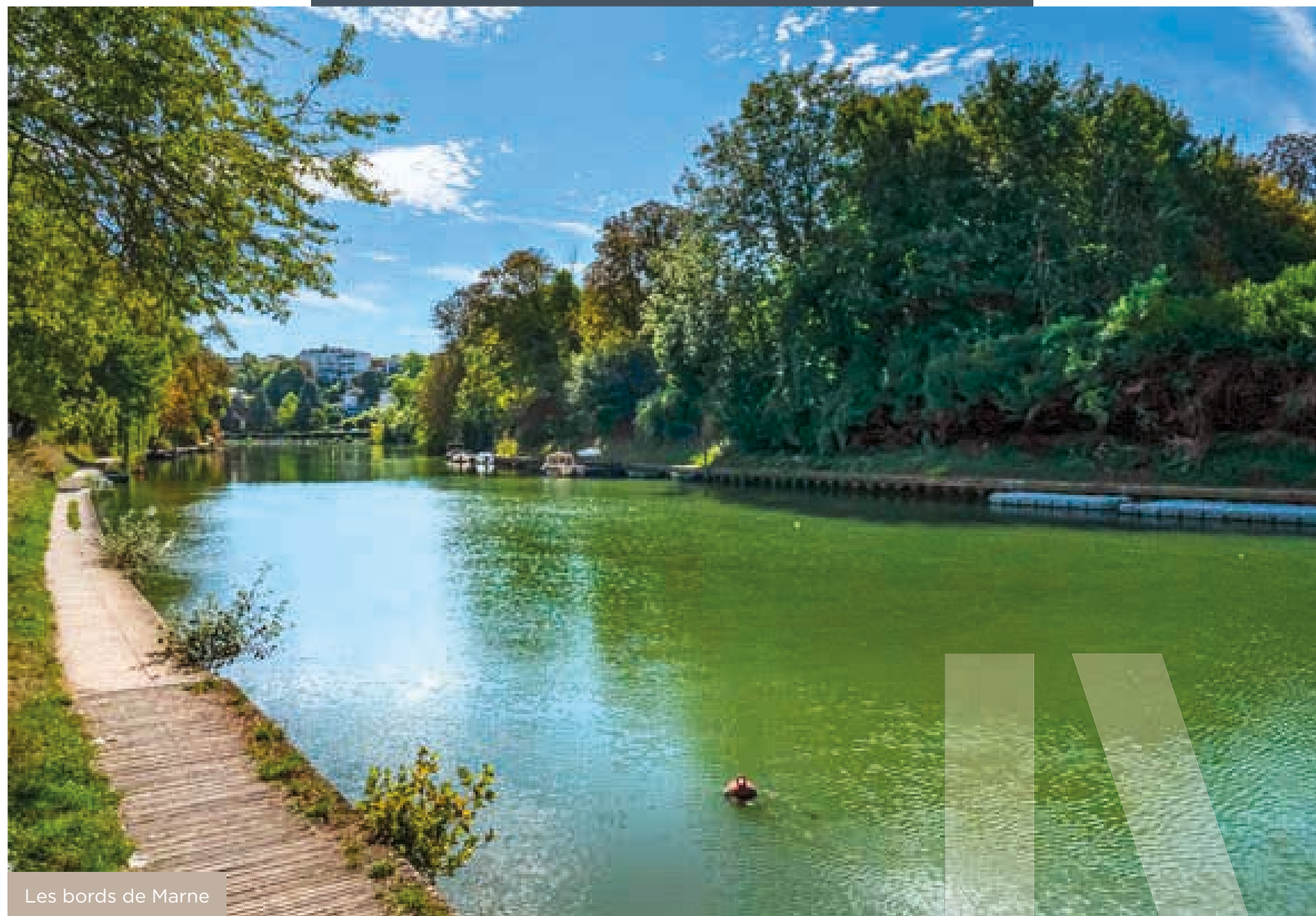
Les bords de Marne

Au quotidien, cette commune privilégiée propose, le long de ses jolies rues arborées et de ses mails végétalisés, des écoles, de nombreux commerces, des enseignes de grandes marques, un marché, des restaurants, des guinguettes au bord de l'eau ainsi qu'une offre culturelle et sportive de qualité. Dès que le temps le permet, la Marne invite les Perreuxiens à profiter de la beauté de ses rives aménagées en prenant son temps, en courant ou à vélo.