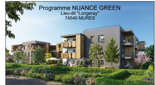
SCCV MURES NUANCE GREEN