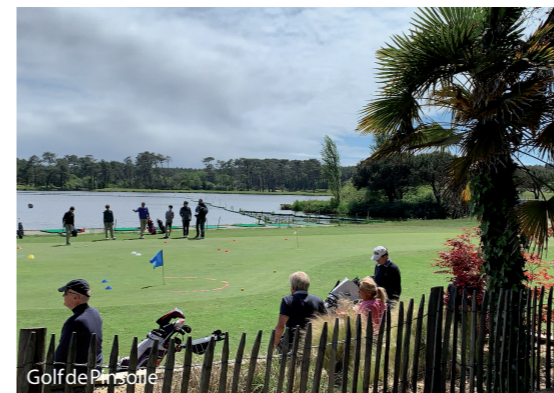
Golf de Pinsolle