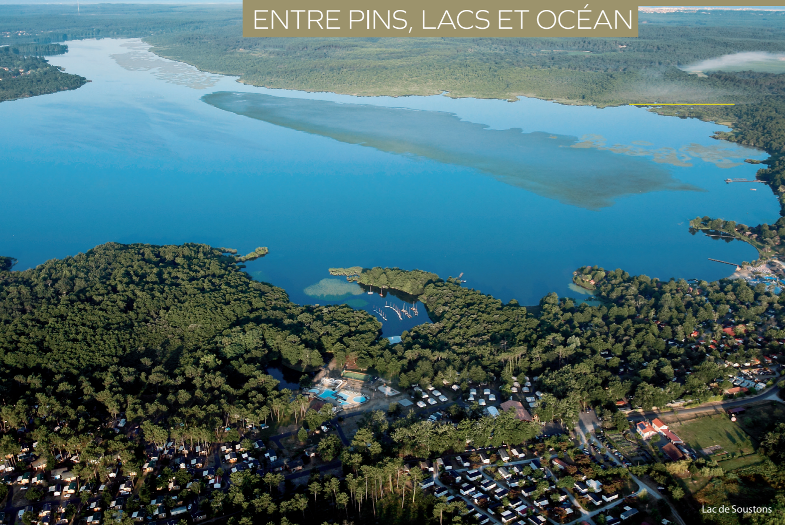
Lac de Soustons

UN TERRITOIRE EXCEPTIONNEL ENTRE PINS, LACS ET OCÉAN