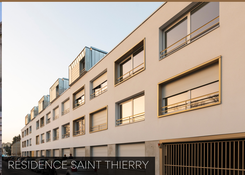
RÉSIDENCE SAINT THIERRY