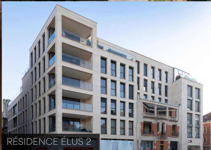
RÉSIDENCE ÉLUS 2