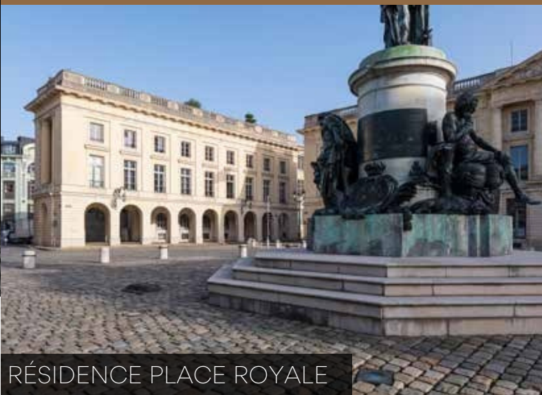
RÉSIDENCE PLACE ROYALE