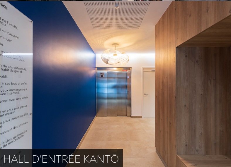
HALL D'ENTRÉE KANTŌ