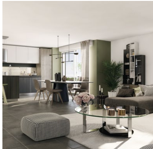
Illustration à caractère d'ambiance - Visuels non contractuels