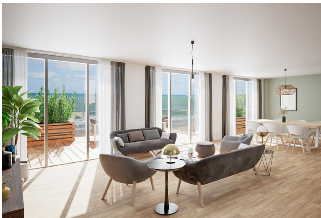
Illustration à caractère d'ambiance - Visuels non contractuels