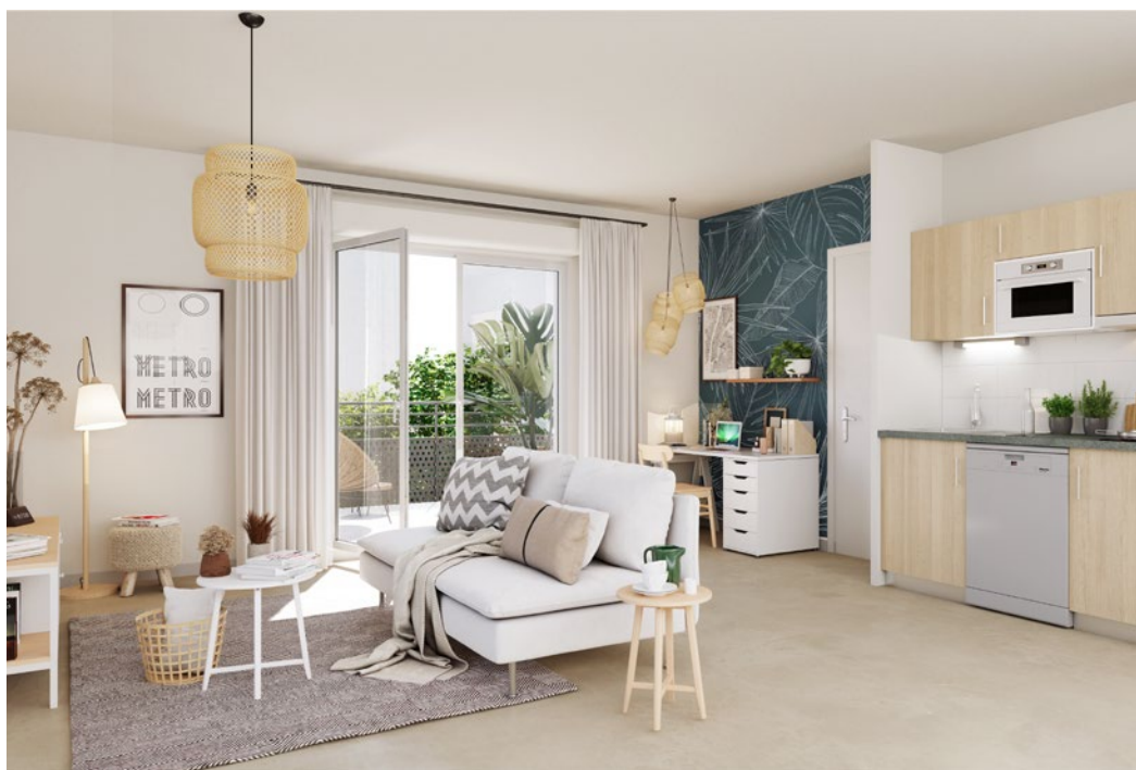
Illustration à caractère d'ambiance - Visuels non contractuels - *Voir plans et notice sommaire