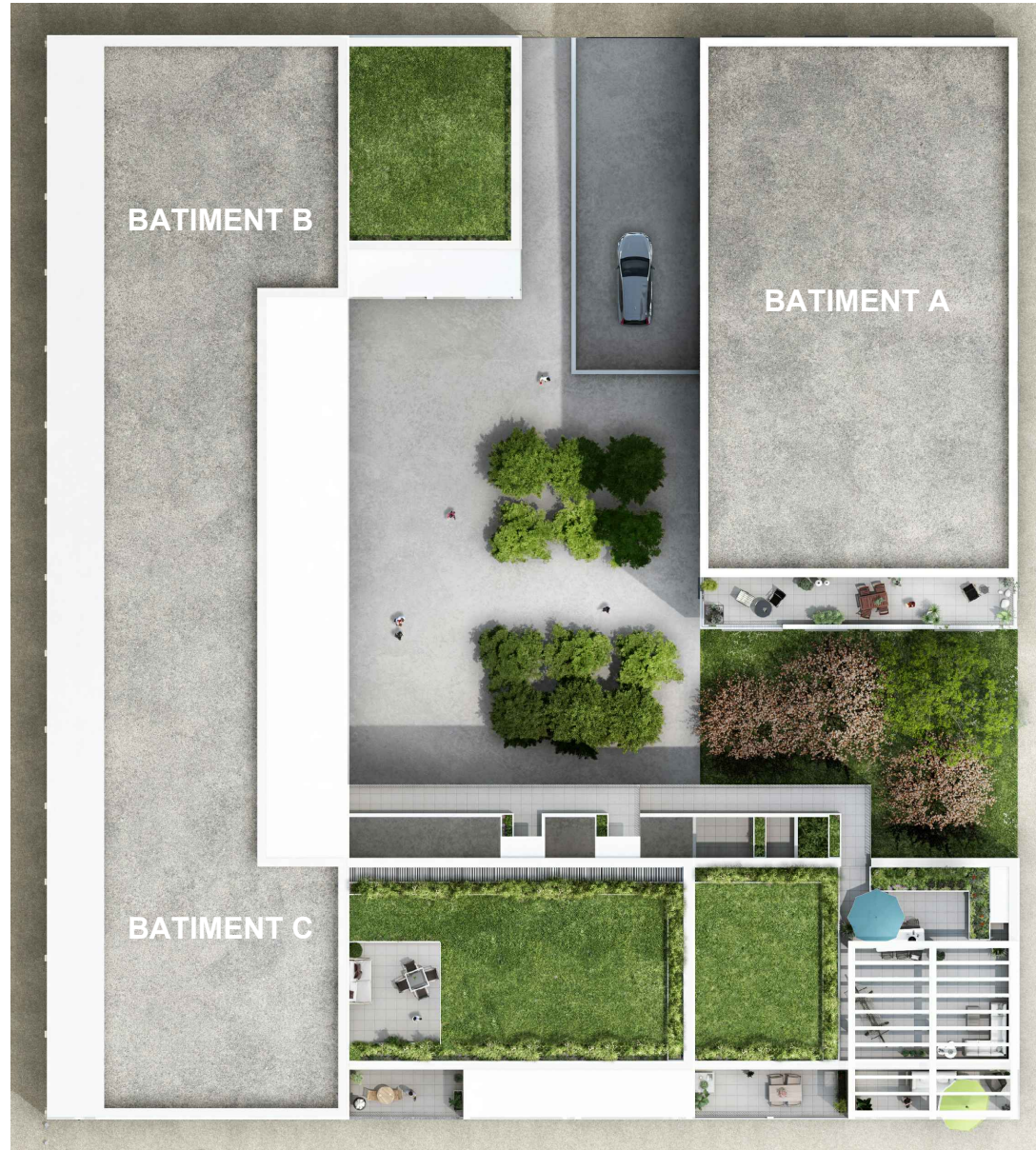
Bâtiments A-B-C PLAN MASSE