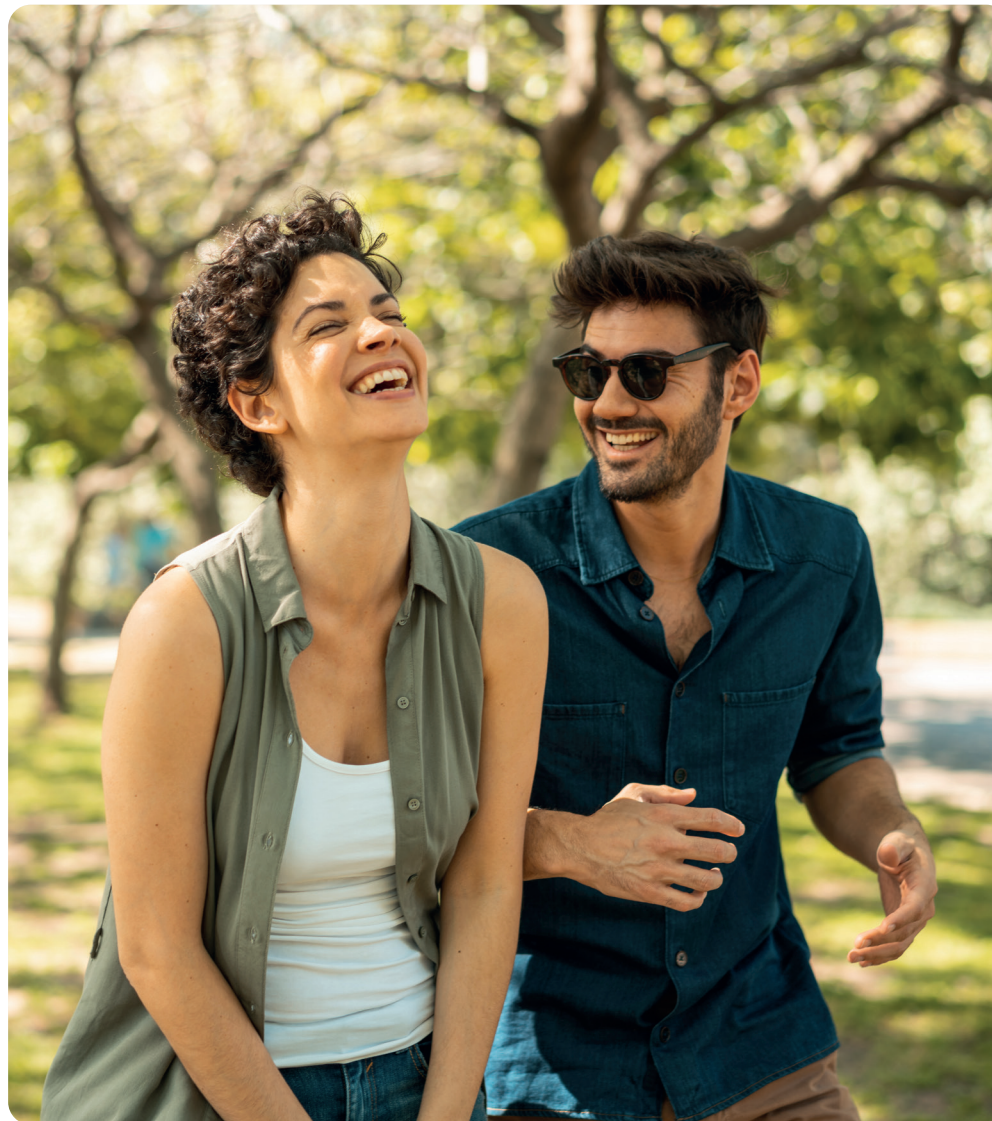
Un cadre de vie privilégié

Situé à l'entrée Sud de Dijon, l'écoquartier de l'Arsenal est un projet urbain global. Cette transformation répond parfaitement aux enjeux de la qualité de vie et à la préservation d'un environnement naturel . Associant habitats, commerces, bureaux, services, crèche, équipements publics, tout en proposant une architecture empreinte de diversité, cet écoquartier est le symbole du dynamisme dijonnais . Depuis la résidence, de multiples commerces et services de proximité sont accessibles rapidement le long de l'avenue Jean Jaurès. Cet écoquartier dispose d'un parc de 2 hectares et bénéficie de la proximité du canal de Bourgogne propice aux promenades et à la détente. Le centre culturel de la Minoterie, situé au cœur de l'écoquartier, est un lieu de vie et d'animation très prisé .