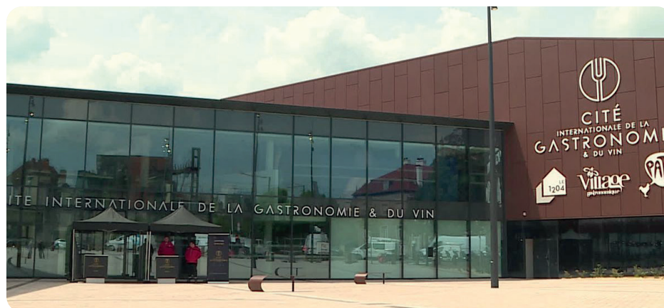
Cité internationale de la Gastronomie et du Vin

Au cœur de la métropole de Dijon, la Cité Internationale de la Gastronomie et du Vin est un nouveau site touristique et culturel d'envergure internationale qui a ouvert début mai 2022. L'objectif est de conforter le positionnement de Dijon comme destination gastronomique et viticole incontournable . La cité gastronomique est un ensemble complet qui comprend à la fois des équipements culturels (des écoles, des espaces d'exposition, un cinéma multiplexe) ainsi que des commerces sur près de 5 000 m 2 .