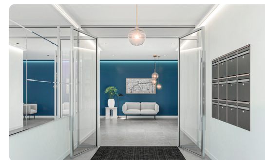
Exemple de hall sécurisé

87 Avenue Jean Jaurès 28 Allée de la Poudrière 21000 Dijon