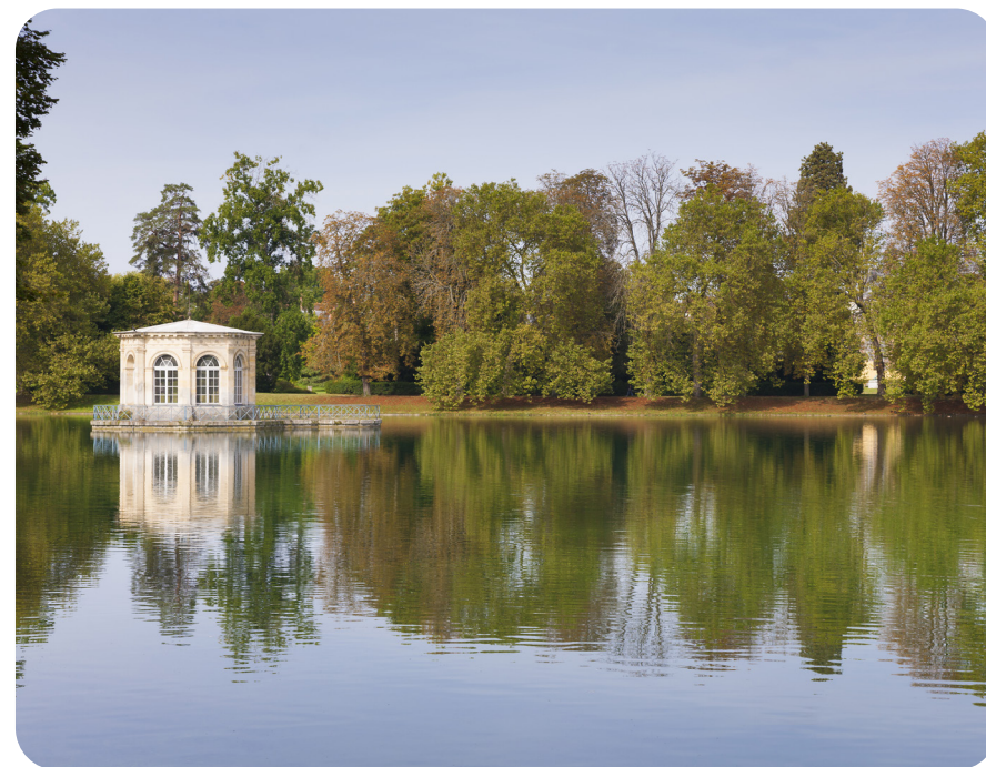
La forêt de Fontainebleau

La position stratégique du département est renforcée par la qualité des équipements de transport : trois autoroutes, quatre routes nationales, deux gares TGV et l'aéroport international Roissy-Charles-de Gaulle . Grâce à sa démographie, la plus dynamique de la région, et une économie florissante, la Seine-et-Marne dispose d'un fort potentiel de développement dans les années à venir.