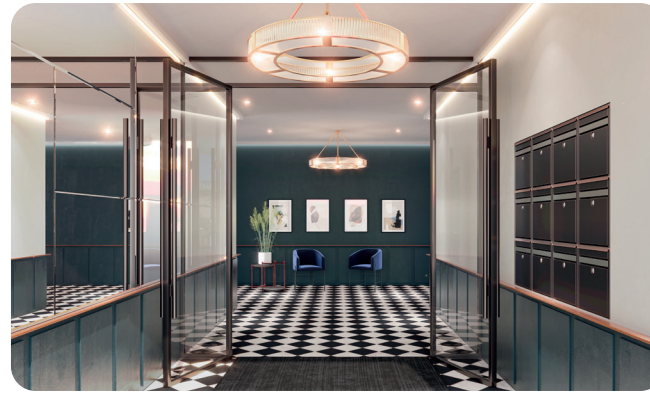
Exemple de hall sécurisé