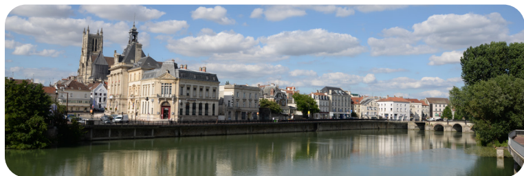
Ville de Meaux

La commune profite des équipements de la Communauté d'Agglomération du Pays de Meaux, notamment en termes de transports et d'emploi. De nombreux chantiers, comme la requalification des Zones d'Activités Économiques de Meaux , ont permis de consolider la dynamique économique locale .