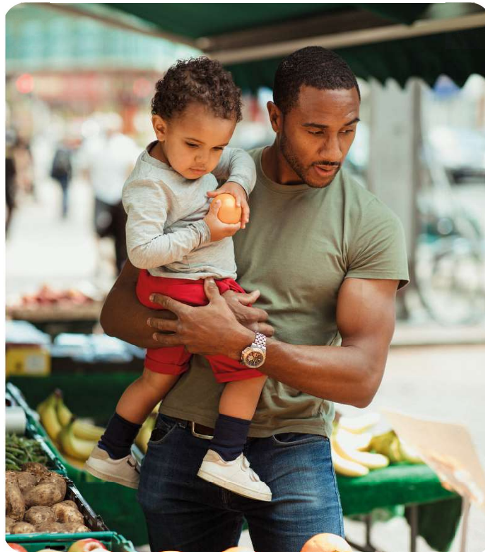
Un cadre de vie confortable

La résidence Centr'Halle est implantée dans le quartier du Plateau, au sein de la ZAC de la Dhuys. Elle participe pleinement au renouveau du quartier en proposant une offre en logements de qualité. Les habitants profitent de la présence du tramway T4 et de l'arrivée prochaine de la ligne 16 du métro , des équipements qui facilitent les déplacements au quotidien. Avec l'installation de nouvelles activités, mais aussi de commerces et services autour de la future gare de Clichy-Montfermeil , chacun pourra profiter d'un cadre de vie plus pratique et agréable .