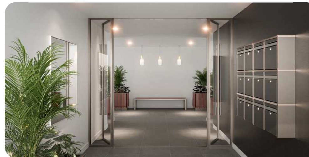
Exemple de hall sécurisé

Allée Romain Rolland / Allée Anatole France 93390 Clichy-sous-Bois