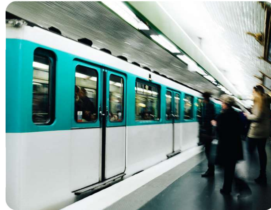
Un réseau de transports parmi les plus développés

Fort de sa population jeune et de son dynamisme économique , le département de la Seine-Saint-Denis poursuit sa transformation. Sa situation géographique aux portes de la capitale et au cœur de la métropole du Grand Paris fait du département un pôle compétitif à l'échelle internationale. Développement d'un tissu économique diversifié , d'un réseau de transport public dense, campus et enseignement supérieur de haut niveau sont autant de facteurs qui contribuent à l'essor de ce territoire. Avec des grands chantiers comme le Grand Paris Express, les Jeux Olympiques et Paralympiques de 2024, le futur de l'Île-de-France s'écrit désormais en Seine-Saint-Denis.