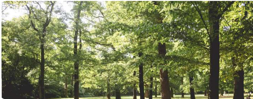
La forêt régionale de Bondy, îlot de verdure de Seine-Saint-Denis

La ville occupe une place essentielle dans le développement de l'Est parisien notamment en matière de transport. Elle a d'ailleurs accueilli récemment la mise en service du tramway T4 . L'offre de transports sera encore étoffée avec l' arrivée de la ligne 16 du métro à l'horizon 2025 (gare de Clichy-Montfermeil). La ville se dote aussi d'un nouveau cœur de ville comprenant des équipements publics, des logements neufs et des espaces verts.