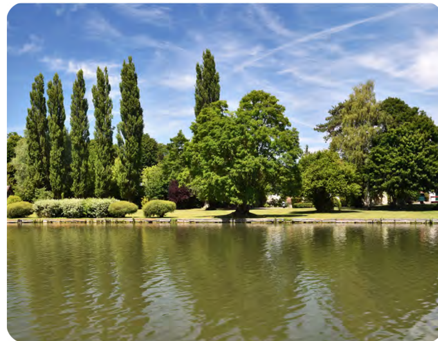
Les berges de l'Oise

Situé dans les Hauts-de-France, le département de l'Oise possède une position privilégiée aux portes de l'Île-de-France . Son interdépendance avec cette dernière constitue un atout important pour le développement du territoire. Les deux départements sont d'ailleurs fortement connectés : RER, Transilien, TER, réseau autoroutier, etc. Mais l'Oise cultive aussi une attractivité qui lui est propre. Les pôles urbains que sont Beauvais, Compiègne et Creil participent activement à son rayonnement économique . À la fois urbaine et très verte, l'Oise se distingue par ses grands massifs boisés , surtout dans sa moitié Est. Les berges de l'Oise , aujourd'hui en grande partie aménagées, sont un lieu agréable et incontournable de promenade . Le département est également riche d'un patrimoine de plus de 600 édifices classés ou inscrits aux Monuments historiques, faisant ainsi de lui un lieu d'Histoire unique.