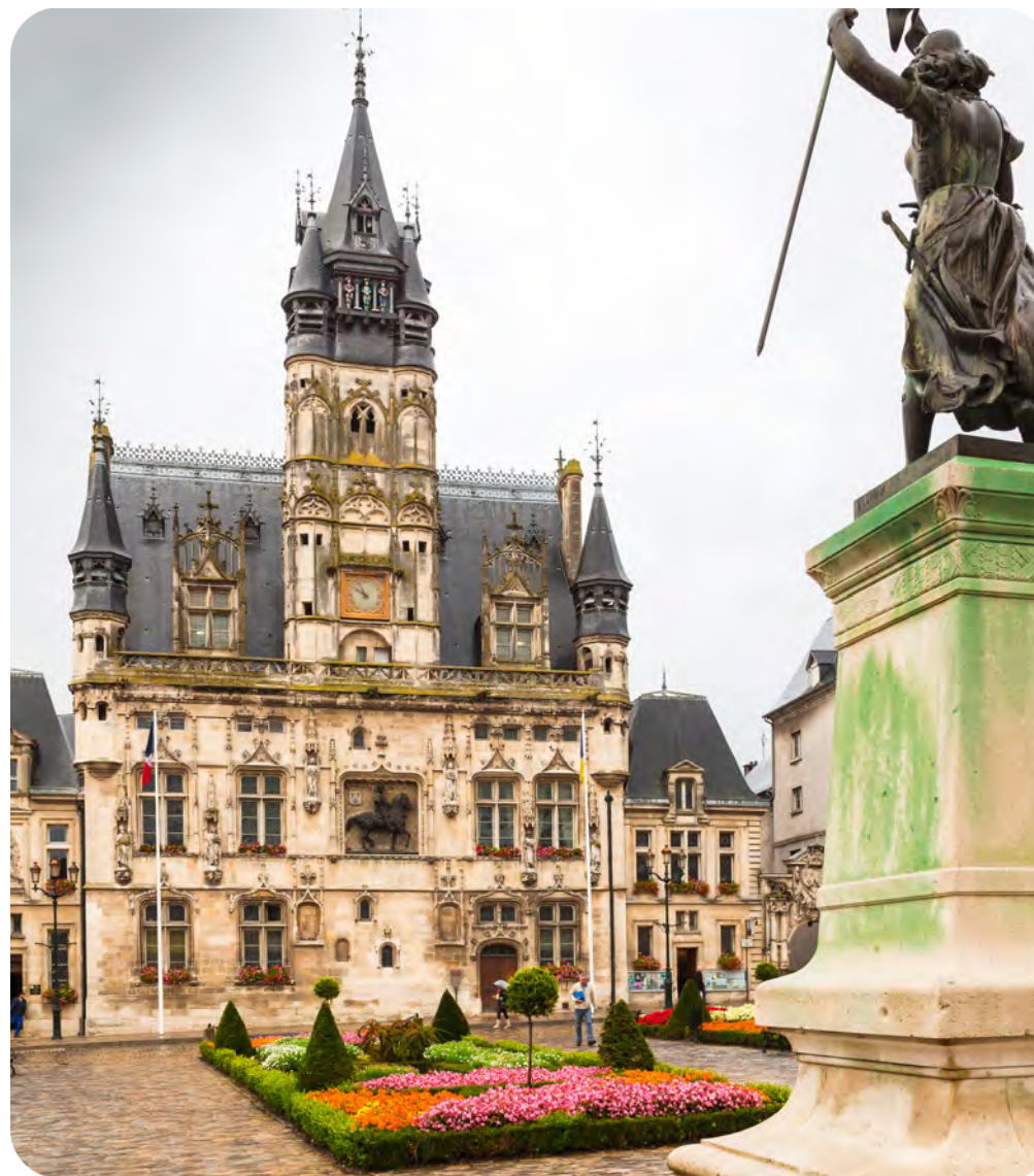
Hôtel de ville de Compiègne

Votre quartier se trouve à la fois à proximité immédiate de la forêt et des pistes cyclables , et au cœur des équipements sportifs (complexe sportif, Hippodrome de Compiègne). Cette diversité laisse aux habitants de Bellicart un grand choix pour leurs moments de détente . C'est un endroit où il fait bon vivre, riche en commerces de proximité , et pour lequel l'offre de transports a été récemment étoffée : ce ne sont pas moins de trois nouveaux trajets directs en bus vers la gare qui ont été ajoutés. Le quartier jouit également de la présence des berges de l'Oise , lieu privilégié pour les balades en famille .