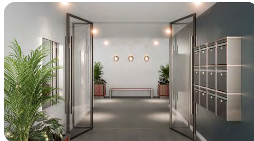
Exemple de hall sécurisé

Rue Charmolue / Rue de l'Estacade 60200 Compiègne