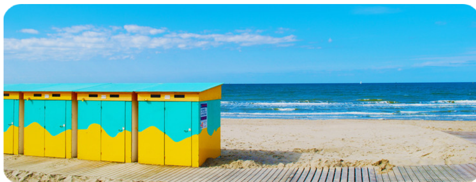
La plage de Malo-les-Bains

Dunkerque est connue pour ses nombreux événements culturels parmi lesquels le fameux Carnaval et le festival la Bonne Aventure. Elle est particulièrement bien dotée en équipements de loisirs variés : nouvelle patinoire, stades, bibliothèques, ainsi que son grand pôle de loisirs. Enfin, la ville a su préserver et mettre en valeur un patrimoine riche issu de son Histoire complexe : ses beffrois, le fort des Dunes, le musée Dunkerque 1940-Opération Dynamo en sont quelques exemples marquants.