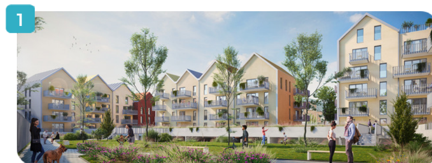
Vue cœur d'îlot