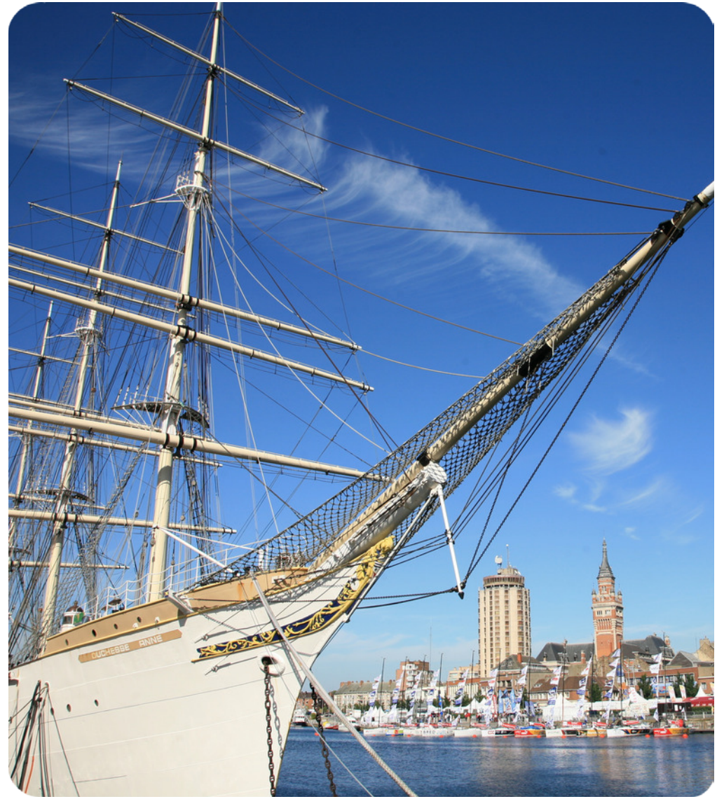
Un port des plus agréables

Quartier historique à l' identité maritime affirmée, la Citadelle accueille ses habitants et les visiteurs du musée portuaire de Dunkerque dans une ambiance conviviale et décontractée . Situé en face du centre-ville et autour des bassins, ce quartier a bénéficié d'une transformation complète et s'affiche désormais comme un lieu agréable et paisible . Sa situation est idéale, à la fois grâce à son accessibilité, à deux pas du centre-ville et de la gare , mais aussi par la présence de nombreux commerces et restaurants qui en font un territoire où il fait bon vivre.