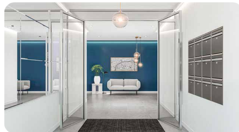
Exemple de hall sécurisé