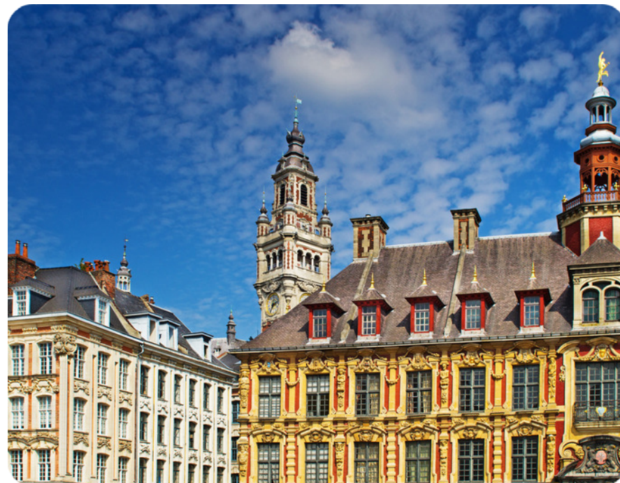
Un carrefour européen culturel et économique de premier plan

Territoire frontalier, le département du Nord s'impose comme un carrefour économique et humain essentiel en Europe. Au centre d'un triangle formé par les métropoles de Bruxelles, Paris et Londres, il profite d'un emplacement particulièrement central et stratégique. Les équipements de transport y sont nombreux et efficaces : cinq autoroutes et un réseau ferré TER-TGV dense, mais également l'Eurostar, desservent le département. Fort d'une économie tertiaire solide , le Nord se positionne aussi en pointe dans les secteurs des biotechnologies et du numérique . Il possède enfin des industries historiques performantes et bien implantées : l'automobile, la métallurgie et le textile. La réputation d'excellence du Nord se fonde en outre sur son identité unique . Son patrimoine, la diversité des paysages de la Flandre à la côte d'Opale, sa culture et sa gastronomie en font un des départements français les plus authentiques.