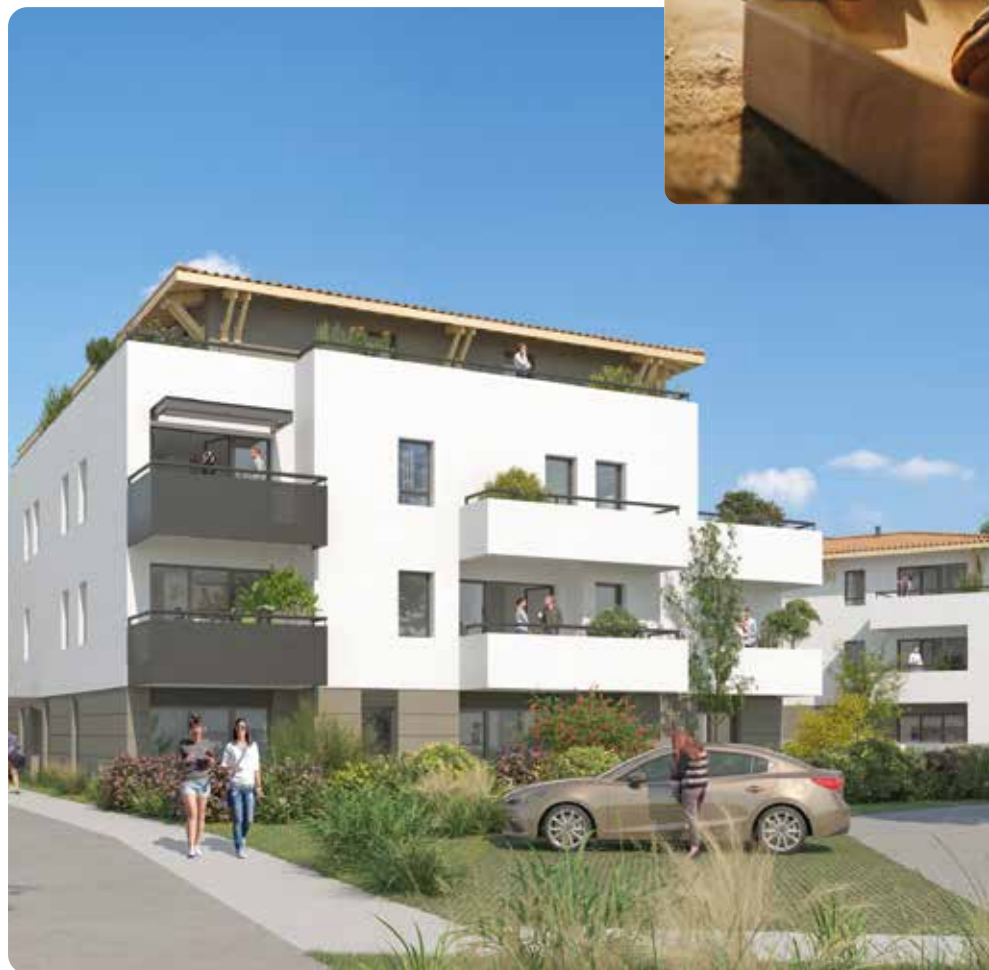
Appartements neufs avec loggia, balcon ou jardin