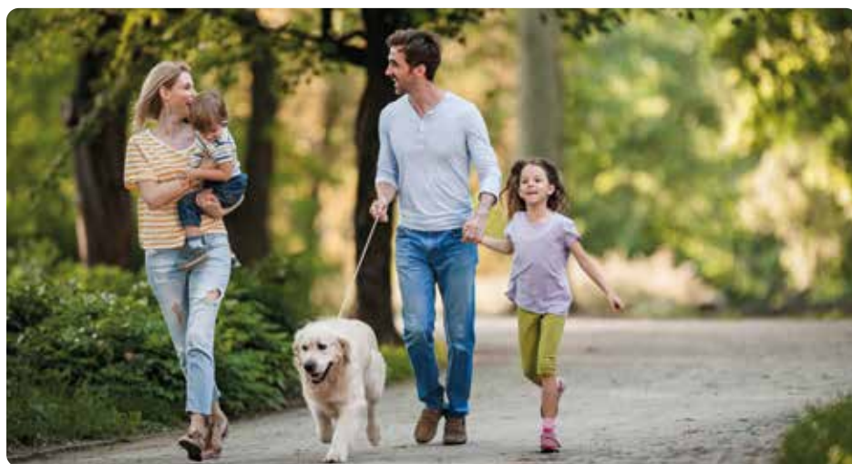
Gradignan, ses espaces naturels et sa douceur de vivre

Prisée pour son dynamisme et sa multitude de petits commerces , Gradignan l'est tout autant pour ses nombreux équipements culturels et de loisirs : médiathèque, ludothèque, théâtre, musée, école de musique, stades et gymnases.