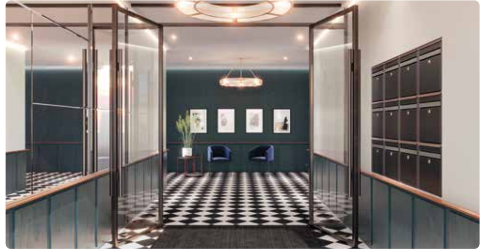
Exemple de hall sécurisé