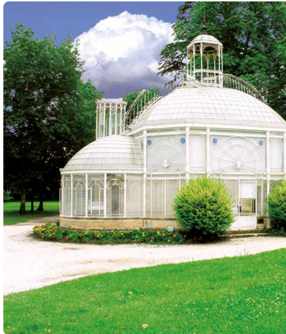
Des parcs verdoyants pour un cadre de vie privilégié

La proximité immédiate du cours du Général de Gaulle et les accès vers la Rocade permettent de se déplacer rapidement dans Gradignan et vers les zones d'activités de la Métropole.