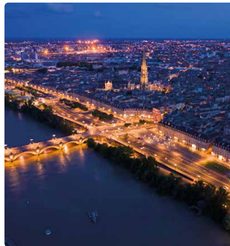
Bordeaux, capitale girondine