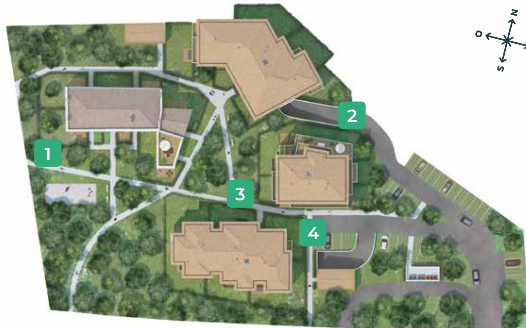
Route de Canéjan