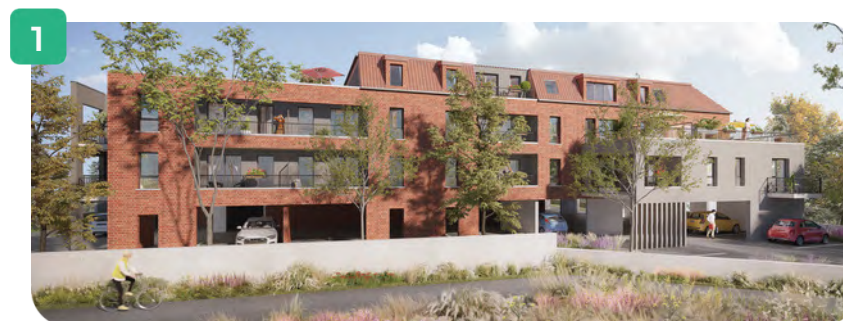
Vue rue du 8 Mai