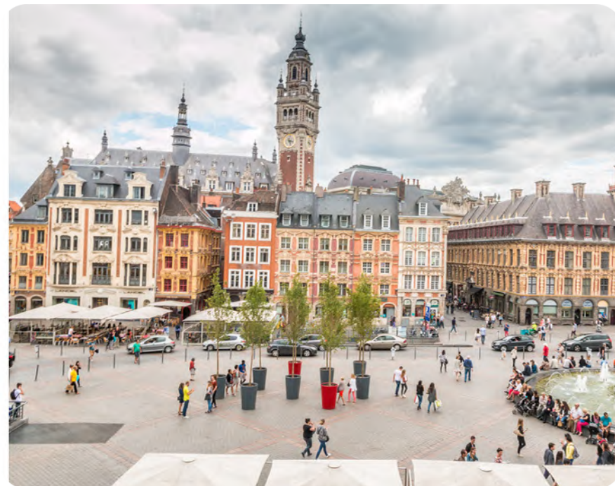
La Grand' Place de Lille

Territoire frontalier, le département du Nord s'est construit sur une Histoire riche ainsi qu'un patrimoine culturel et gastronomique unique. La diversité des paysages de la Flandre à la côte d'Opale fait également sa réputation. Il s'impose comme un carrefour économique et humain essentiel en Europe. Le département profite d'un emplacement stratégique, au centre d'un triangle formé par les métropoles de Bruxelles, Paris et Londres. Les équipements de transport y sont nombreux et efficaces : cinq autoroutes et un réseau ferré TER-TGV dense, mais également l'Eurostar, le desservent. Fort d'une économie tertiaire solide, le Nord se positionne aussi en pointe dans les secteurs des biotechnologies et du numérique. Il possède enfin des industries historiques performantes et bien implantées : l'automobile, la métallurgie et le textile.