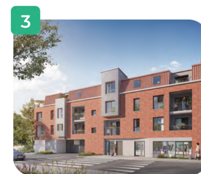
Vue rue Demesmay