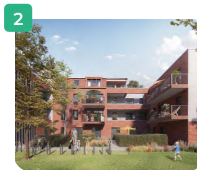
Vue cœur d'îlot