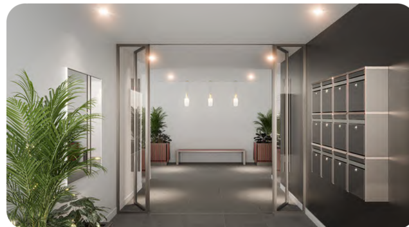
Exemple de hall sécurisé