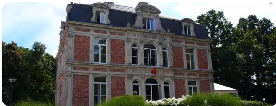
Mairie de Templeuve

Aéroport de Lille - Lesquin à 10 minutes en voiture