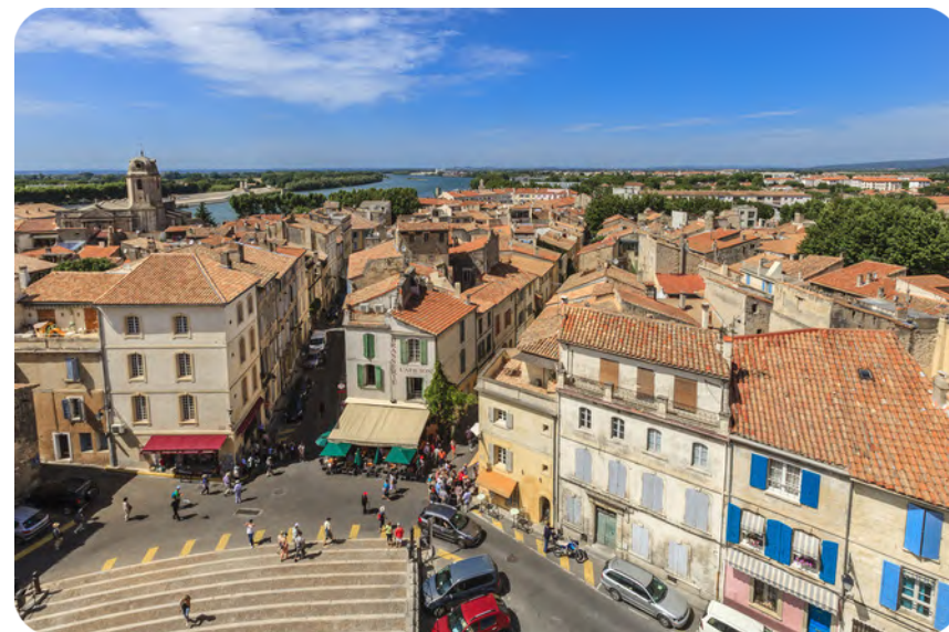
Le centre-ville d'Arles

La cité arlésienne profite d'un accès facilité vers Marseille et Montpellier . Aux confluences de la Provence et de la Camargue , 51 000 habitants bénéficient des atouts majeurs d'une ville dynamique et bien desservie permettant des déplacements aisés vers les villes voisines. Elle est également un carrefour d'échanges important au cœur des axes Espagne-Italie .