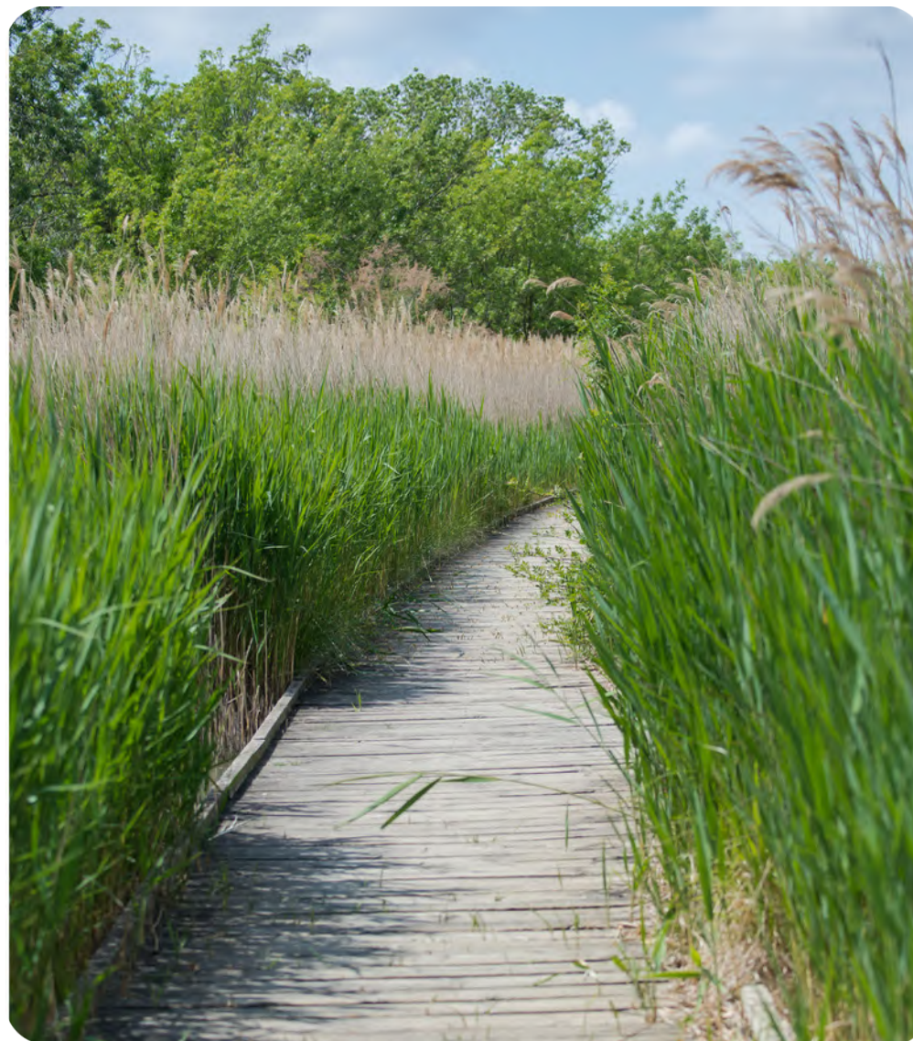
Marais du Vigueirat

Une résidence qui séduira de nombreux investisseurs par sa situation géographique et son accessibilité !