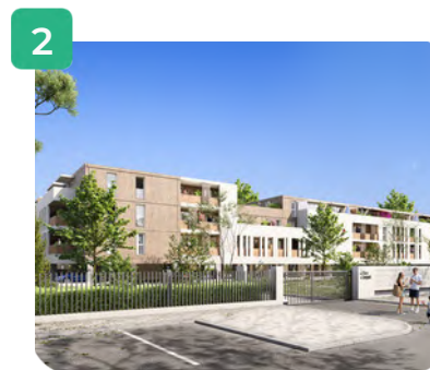
Vue depuis l'entrée