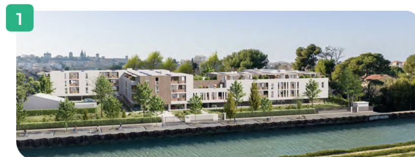
Vue depuis le canal