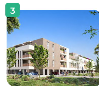
Vue côté jardin