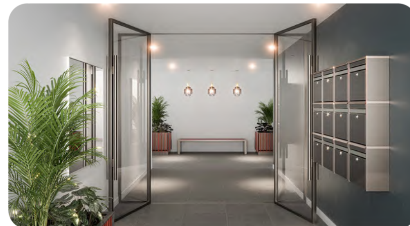
Exemple de hall sécurisé