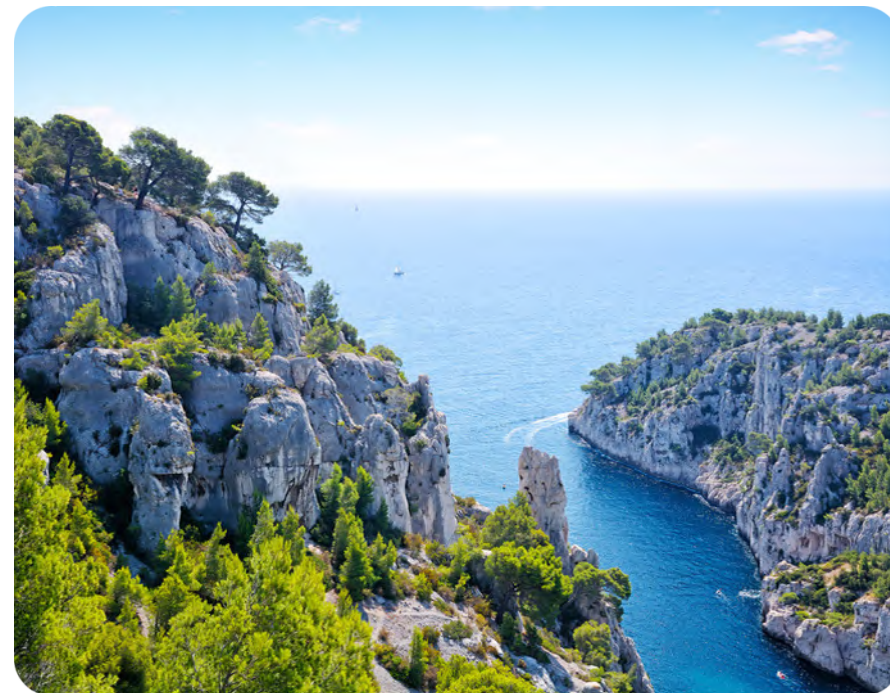
Calanques de Marseille

De superbes stations balnéaires font le bonheur de ses habitants et des touristes : Marseille, La Ciotat, Carry-le-Rouet, Sausset-les-Pins et également Cassis.