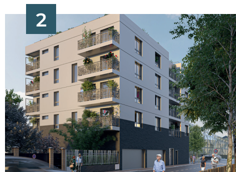
Vue rue Heurtault