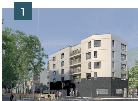
Vue angle de l'av. du Président Roosevelt et de la rue Heurtault