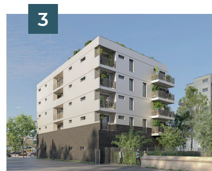
Servitude donnant sur l'av. Franklin Roosevelt