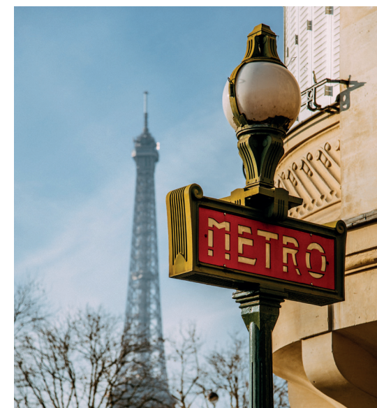
Panneau métro à Paris

Située aux portes de Paris, Aubervilliers profite d'un emplacement privilegié . La ville, déjà bien desservie par les transports, s'apprête à recevoir la nouvelle ligne 15 du Grand Paris Express (deux gares) et profite du prolongement de la ligne 12 depuis mai 2022. Aubervilliers est aussi au cœur de projets d'envergure destinés à pourvoir la ville en équipements de qualité. La rénovation des quartiers engagée depuis déjà quelques années se poursuit avec, entre autres, la réalisation d'un écoquartier et l' aménagement des berges du canal Saint-Denis en espaces de détente, verdoyants et accueillants. De nombreux commerces (10 000 m 2 de surface) doivent également voir le jour pour compléter l'offre déjà présente, notamment avec le centre commercial Le Millénaire .