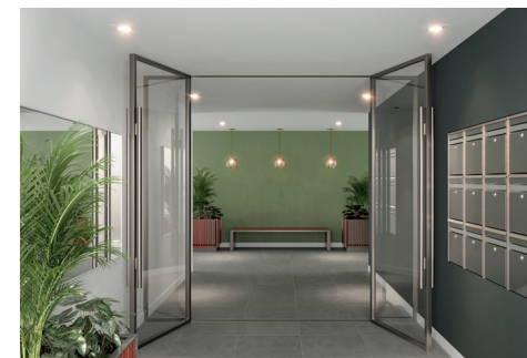
Exemple de hall sécurisé et connecté