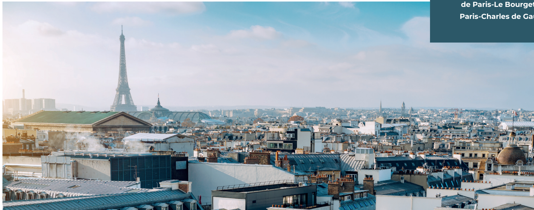
Paysage urbain de Paris

Avec des grands chantiers comme le Grand Paris Express, les Jeux Olympiques et Paralympiques de 2024, le futur de l'Île-de-France s'écrit désormais en Seine-Saint-Denis.