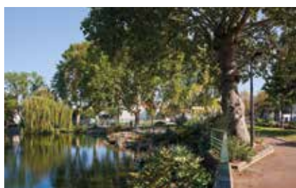
Lac de Sévigné