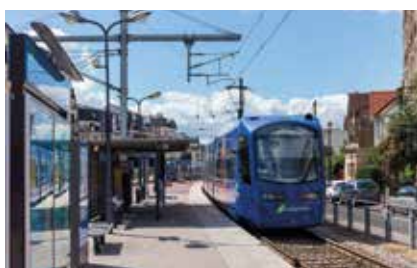
Gare de Gargan - T4