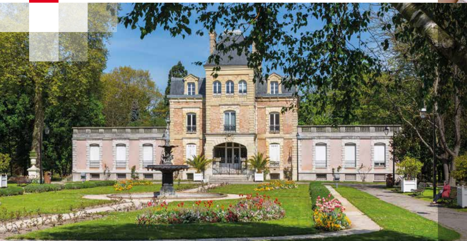
Château de la Forêt