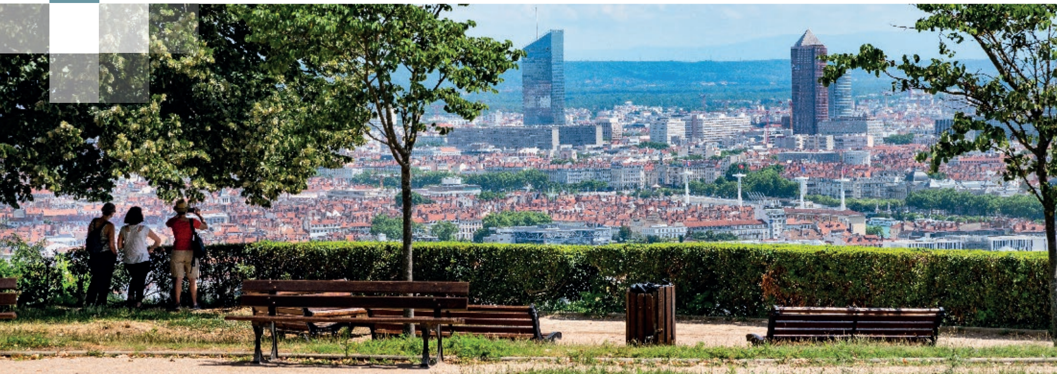
Esplanade avec vue sur Lyon