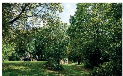
Parc de Brûlet