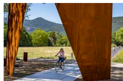
Les « Portes Bonheur »