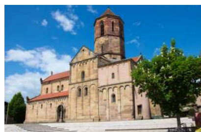
L'église romane datant du X ème siècle

Chaque semaine, un marché plein de charme, réunissant les producteurs locaux, se déroule au cœur de la cité romane. Des commerces de proximité côtoient de grandes enseignes. Des adresses gourmandes ont tout pour séduire vos papilles. Les nombreuses associations de sports et loisirs, ainsi que la médiathèque Josselmann, sont sources d'émotions grandeur nature. Sans oublier la jeunesse, avec les écoles maternelles, l'école élémentaire et le collège, facile d'accès, grâce à la voie verte « Portes Bonheur ». 11 km de douceur de vivre !