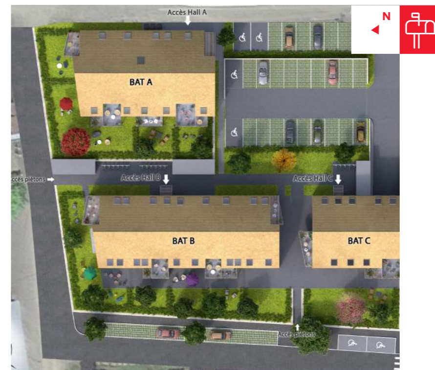
Plan de masse du « Clos Romane »

Ici, on sait prendre son temps. Le temps de vivre. Le temps de flâner. Le temps de s'émerveiller. Pour s'en convaincre, il suffit de cheminer sur la voie verte qui traverse Rosheim, aménagée sur une ancienne voie de chemin de fer, les « Portes Bonheur ». À vous la belle vie !