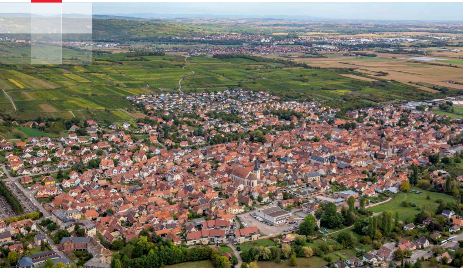
Rosheim vue du ciel