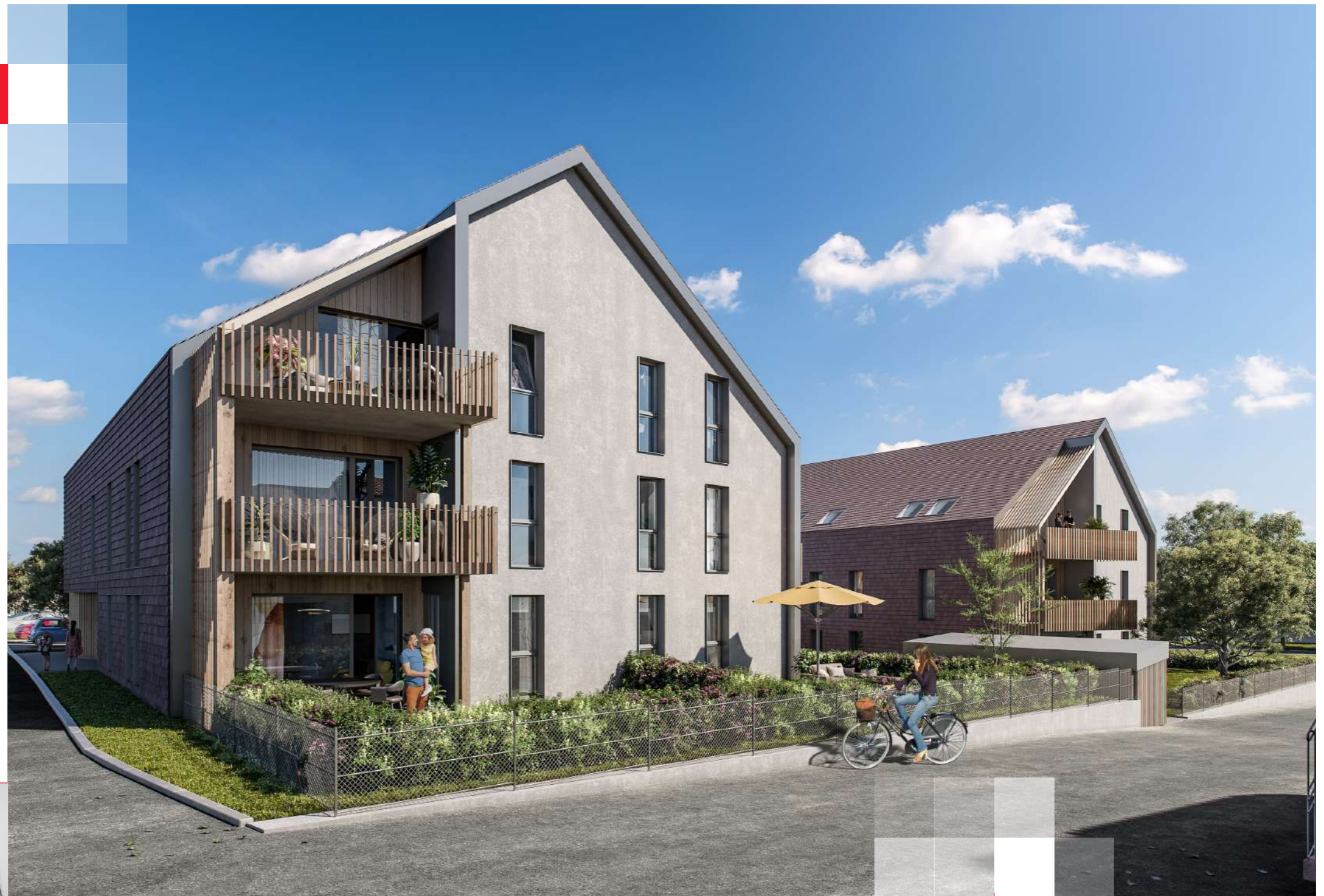
Vue depuis la rue Mittelweg