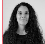
Émilie DEPIERRE LAMA ARCHITECTES

La végétation est omniprésente : les jardins sont arborés et privatifs entourés de haies, les locaux abritant les vélos présentent des toitures végétalisées. La voiture est stationnée sur un parking paysager en contre-bas, de part et d'autre d'espaces plantés. Les circulations douces sont nombreuses, elles sont autant de lieux de rencontres, pour petits et grands.