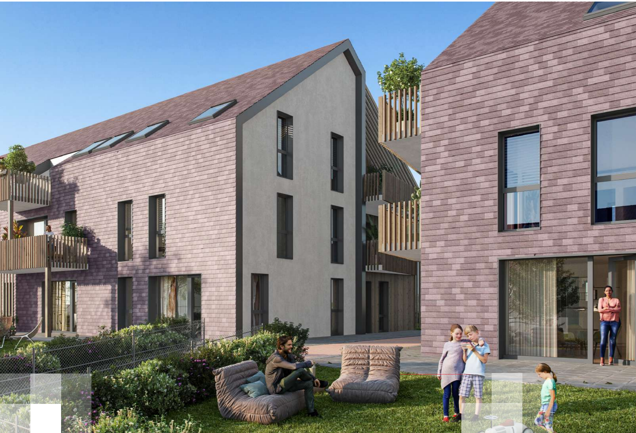
Vue depuis un jardin du « Clos Romane »