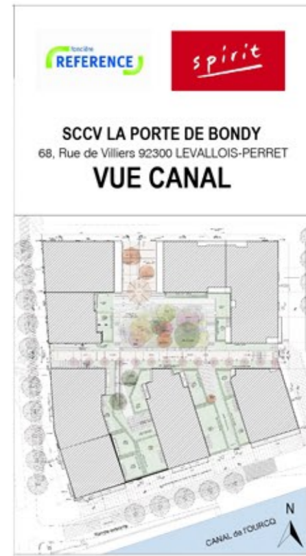
Plan du sous-sol et niveaux 50.60/51.30/51.65/52.40 NGF

Nota : Ces plans sont valables sous réserve de modifications qui seraient imposées par des impératifs techniques en cours de construction. Une différence de 5% sur les cotes et surfaces exprimées par les plans seront tenues pour admissibles et ne pourront fonder aucune réclamation. Les surfaces de placard sont incluses dans les pièces attenantes.